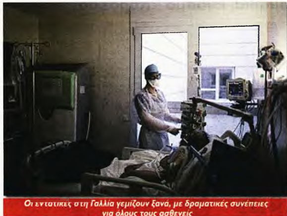
Οι εργατικές στη Γαλλία γερμίζουν ξανά, με δραματικές συνέπειες για όλους τους ασθενείς

Την ίδια ώρα, εντείνονται ο σφοδρός ενδοϊμπεριαλιστικός ανταγωνισμός γύρω από τα εμβόλια και τους εμβολιασμούς καθώς και οι επιχειρηματικές συμπράξεις όπου τα μονοπώλια μυρίζονται κέρδη και «ευνοϊκό επενδυτικό περιβάλλον».