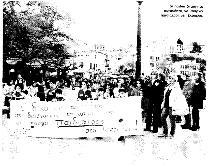
Τα παιδιά ζητούν το αυτονόμο, να υπάρχει παιδίατρος στη Σκόπελο.

Εξίσου σημαντικό είναι ότι υπάρχουν μόλις τρεις οδηγοί ασθενοφόρου οι οποίοι πολλές φορές