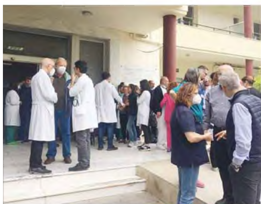
Οι εργαζόμενοι κάνουν λόγο για μια κατάσταση που όχι μόνο εγκυμονεί κινδύνους για την εύρυθμη λειτουργία του νοσοκομείου, αλλά και για την ασφάλεια των ιατρικών πράξεων που εκτελούνται.

■ Στάση εργασίας πραγματοποιήσαν χθες γιατροί και εργαζόμενοι του νοσοκομείου, με φόντο την υποστελέχωση του ιδρύματος