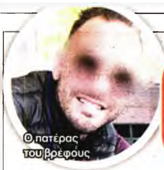
Ο πατέρας του βρέφους