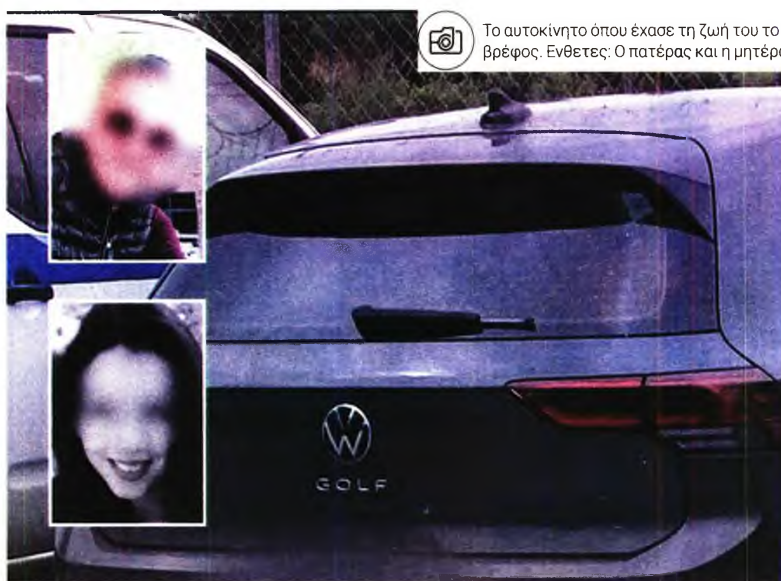
Το αυτοκίνητο όπου έχασε τη ζωή του το βρέφος. Ενθετες: Ο πατέρας και η μητέρα

Μετά τον θάνατο του 5,5 μηνών μωρού το οποίο ο πατέρας ξέχασε μέσα στο αυτοκίνητο, βρέθηκαν σε χώρο του Νοσοκομείου Αρτας