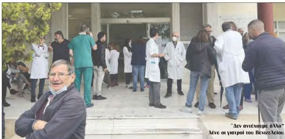
"Δεν αντέχουμε άλλο" λένε οι γιατροί του Βενιζελείου

Οι κενές οργανικές θέσεις ιατρών προσεγγίζουν τις 40, όμως προκηρύχθηκαν μόνο 12, πολλές εκ των οποίων θα βγουν άγονες, λόγω έλλειψης κινήτρων".