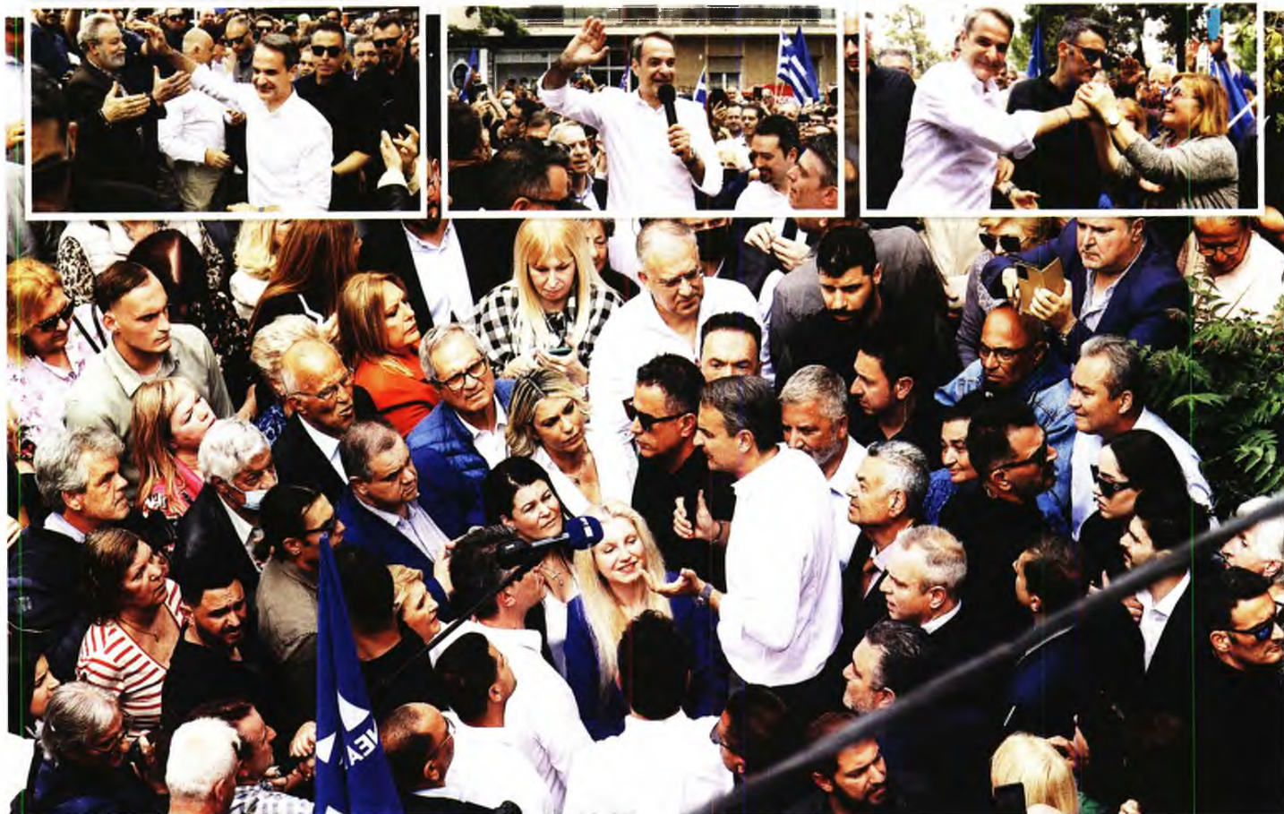
* Στιγμιότυπα από τη χθεσινή ομιλία του Κυριάκου Μητσοτάκη στην πλατεία Άνοιξης του Δήμου Ζωγράφου