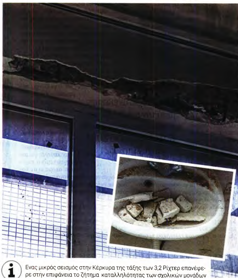
Ένας μικρός σεισμός στην Κέρκυρα της τάξης των 3,2 Ρίχτερ επανέφερε στην επιφάνεια το ζήτημα καταλληλότητας των σχολικών μονάδων

Οι έλεγχοι θα γίνουν, κατά σειρά προτεραιότητας, σε κτίρια όπου στεγάζονται δημόσιες και ιδιωτικές εκπαιδευτικές μονάδες όλων των βαθμίδων, δημόσια και ιδιωτικά νοσοκομεία και κέντρα υγείας, υπηρεσίες της Ελληνικής Αστυνομίας, του Πυροσβεστικού Σώματος, δημόσιες επιτελικές υπηρεσίες για την αντιμετώπιση εκτάκτων αναγκών από σεισμό και, εν συνεχεία, στα υπόλοιπα κτίρια.