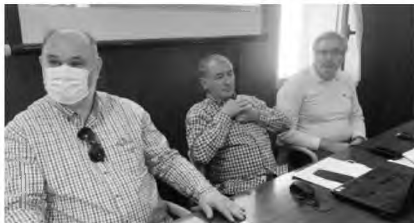
Το κλιμάκιο της ΠΟΕΔΗΝ επισκέφτηκε χθες το Νοσοκομείο Βόλου

«Από το 2010 μέχρι τώρα πάνω από 39.000 αποχωρήσεις που δεν έχουν καλυφθεί. Διαχρονικά 20.000 κενά. Οι υποσέ-