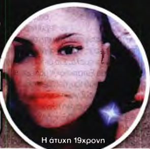
Η άτυχη 19χρονη

Ο άδικος θάνατος της 19χρονης εγκύου στην «ακρική» Νέα Μάκρη προκάλεσε την παρέμβαση του προϊσταμένου της Εισαγγελίας Πρωτοδικών της Αθήνας Αντώνη Ελευθεριάνου, ο οποίος διέταξε τη διενέργεια προκαταρκτικής εξέτασης, καθώς οι συγγενείς της αποδίδουν την τραγική της κατάληξη σε καθυστέρηση του ασθενοφόρου του ΕΚΑΒ. Στο πλαίσιο της προκαταρκτικής εξέτασης, την οποία θα διενεργήσει η προϊσταμένη της Πονικής Διώξης, εισαγγελέας Αγγελική Τριανταφύλλου, θα ερευνηθούν ποινικές ευθύνες προς πάσα κατεύθυνση, εφόσον υπάρχουν, για την έγκαιρη διακομιδή της 19χρονης Ελενας από τη Νέα Μάκρη στο Κέντρο Υγείας, Ένορκη Διοικητική Εξέταση (ΕΔΕ) με κατεπείγοντα χαρακτήρα έχει διαταχθεί από το ΕΚΑΒ και από την 1η Υγειονομική Περιφέρεια της Αττικής (1η ΥΠΕ) προκειμένου να διερευνηθούν οι συνθήκες και η τήρηση των