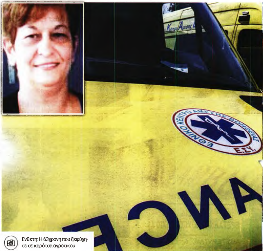
Ενθετή: Η 63χρονη που ξεψύχησε σε καρότσα αγροτικού