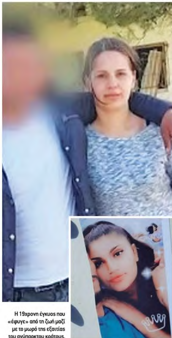
Η 19χρονη έγκυος που «έφυγε» από τη ζωή μαζί με το μωρό της εξαιτίας του ανύπαρκτου κράτους.

Λίγες ώρες μετά τον θάνατο 63χρονος στην Κω σε καρύτσα αγροτικού, επειδή δεν υπήρχε ασθενοφόρο, μια ακόμη οικογένεια θρηνεί μια 19χρονη έγκυο που έσβησε αβοήθητη για τον ίδιο λόγο, στο σύστημα υγείας του Κούλη και του υπουργού Υγείας, θάνου Πλεύρη.