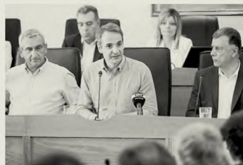
Από την επίσκεψη τον Ιούνιο του 2022 του πρώην πρωθυπουργού στην Κω, όπου είχε ανακοινώσει την ανέγερση του νοσοκομείου