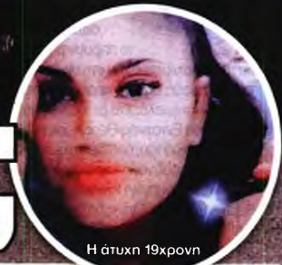
Η άτυχη 19χρονη

σίως Κοτανίδου και, σύμφωνα με κύκλους του υπουργείου Υγείας, οι ευθύνες θα αποδοθούν μετά την ολοκλήρωση της σχετικής έρευνας, ενώ παράλληλα αναμένουν και τα πορίσματα των ΕΔΕ από την 1η ΥΠΕ και το ΕΚΑΒ.