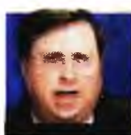
Γράφει ο Κ. Αϊβαλιώτης τ. Βουλευτής Β' Αθηνών

βραβευμένο πρόγραμμα του Συλλόγου ασθενών με Πάρκινσον, το οποίο παρέχει παράλληλα και υψηλή ποιότητα ζωής. Μπορείτε να πληροφορηθείτε τα πάντα για την δωρεάν συμμετοχή σε αυτό με ένα τηλεφώνημα στο 698/5026708. Είναι γεγονός ότι, αν και δεν υπάρχουν προληπ-