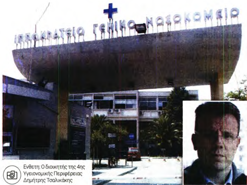
Ενθετή: Ο διοικητής της 4ης Υγειονομικής Περιφέρειας Δημήτρης Τσαλικάκης

Η 4η Υγειονομική Περιφέρεια διενεργεί προκαταρκτική προκειμένου να αποδοθούν ευθύνες για την αδυναμία να κάνει το παιδί μια αξονική