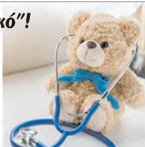
Στο ΠΑΓΝΗ μεταφέρθηκαν τα δύο μικρά παιδιά που είχαν καταπιεί ξένα σώματα

"Ωρα 02.30, μετά τα μεσάνυχτα. Δύο παιδάκια μαζεμένα, με ξένα σώματα διακομίζονται επείγοντως στο ΠαΓΝΗ. Ταυτόχρονα. Το ένα δυόμισι ετών διακομίδι από Ρέθυμνο με αναφερόμενη εισρόφηση μπίλιας από σφυρίχτρα (!) στους βρόγχους. Το άλλο, δύο ετών από Βενιζέλιο, με αναφερόμενη κατάποση ξύλου από σουβλάκι στον υποφάρυγγα. Δύο χειρουργεία που πιστεύω να πάνε καλά. Η λε-