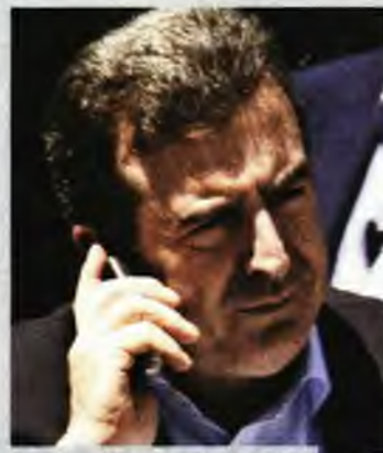
Ο νέος υπουργός Υγείας Μιχάλης Χρυσοχοΐδης.

Ο νέος υπουργός Υγείας έδειξε από την πρώτη κιόλας ημέρα ότι έλαβε στα σοβαρά τα λόγια του πρωθυπουργού για «λιγότερα λόγια και περισσότερες πράξεις». Έτσι χθες ο Μιχάλης Χρυσοχοΐδης θέλησε να εξακριβώσει ιδίοις όμμασι την κατάσταση που επικρατεί στο Εθνικό Σύστημα Υγείας . Νωρίς λοιπόν το πρωί -πριν από το πρώτο υπουργικό, δηλαδή- επισκέφθηκε αιφνιδιαστικά το νοσοκομείο «Ευαγγελισμός» στην Αθήνα, προκειμένου να ενημερωθεί για την κατάσταση που επικρατεί στο μεγαλύτερο νοσοκομείο της χώρας. Ο νέος υπουργός Υγείας έφτασε στον «Ευαγγελισμό» λίγο μετά τις οκτώ το πρωί, ξαφνιάζοντας τους εργαζομένους, με τους οποίους συνομίλησε για αρκετή ώρα σχετικά με τα ζητήματα που απασχολούν το νοσοκομείο . Ακολούθως, μαζί με τους συνεργάτες του κα-