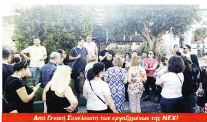
Από Γενική Συνέλευση των εργαζομένων της NEXI

Όπως έχει καταγγείλει το Σωματείο, στις 29 Ιούνη η εταιρεία «μας ανακοίνωσε όσα ακούγονταν ως φήμες το τελευταίο διάστημα: Ότι το έργο της εξυπηρέτησης της Alpha Bank χάθηκε και η εταιρεία δεν επι-