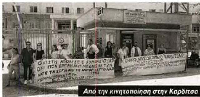
Από την κινητοποίηση στην Καρδίτσα

Οι εργαζόμενες μετέφεραν την απαίτησή τους για μονιμοποίηση όλων όσοι δουλεύουν με συμβάσεις, διατρανώνοντας «Έξω οι εργολάβοι από το νοσοκομείο και από την καθαριότητα» . Την κινητοποίηση χαιρέτισε και ο Εκτορας Γάζος, πρόεδρος της ΕΙΝΚΥΝΚ , αναδεικνύοντας ότι η παραχώρηση τομέων σε εργολαβικές εταιρείες στηρίζεται στο νομοθετικό