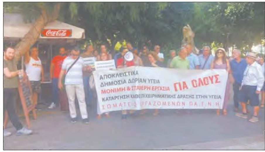
Κινητοποίηση για την "προώθηση της ιδιωτικής υγείας την ίδια ώρα που υποβαθμίζεται η δημόσια"

Τη συμπαράσταση στη διαμαρτυρία εξέφρασαν η Ένωση Γιατρών Ν. Ρεθύμνου, το Σωματείο Εργαζομένων στο νοσοκομείο Σπ-