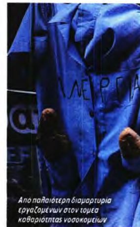
Από παλιότερη διαμαρτυρία εργαζομένων στον τομέα καθαριότητας νοσοκομείων

«Οι δέκα συνέχισαν παρακαλώντας στον ιδιώτη, με πολύ διαφορετικές συνθήκες εργασίας από ό,τι πριν και βέβαια δεν είναι σίγουρες. Μπορεί να ήταν λίγα τα χρήματα, αλλά με αυτά καλύπταμε κάποιες βασικές ανάγκες του νοικοκυριού, ειδικά τώρα με την ακρίβεια παντού. Με τις συμβάσεις ορισμένου χρόνου παίρναμε 5 ευρώ την ώρα που και πάλι ήταν λίγα και τώρα δουλεύουν για 3,5 ευρώ την ώρα. Γυναίκες που εργαζόταν 22 χρόνια στο νοσοκομείο, γυναίκες που ήταν μισό και έναν χρόνο πριν από τη σύνταξη. Ο εργολάβος μάζευε βιογραφικά απ' έξω ενώ υπήρχε η εγγύηση από τη διοίκηση ότι θα