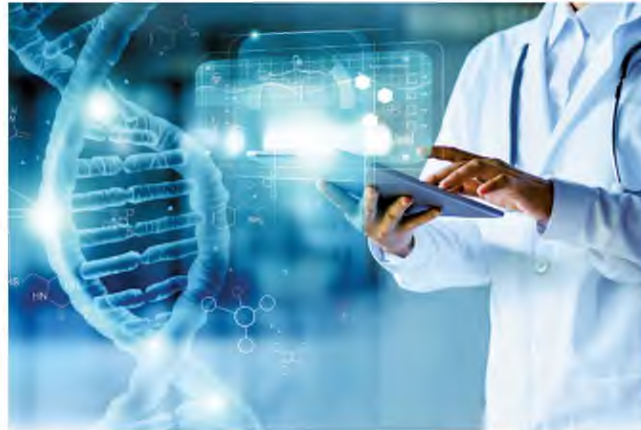
Κοινή επιδίωξη η άμεση, ποιοτική, με υψηλά πρότυπα φροντίδα κάθε πολίτη που ασθενεί.

ΑΥΤΟ που μοιάζει σίγουρο είναι πως η ιδιωτική υγειονομική περίθαλψη στην Ελλάδα αναμένεται να αντιμετωπίσει μία αυξανόμενη ζήτηση στο άμεσο μέλλον. Αυτό μπορεί να αποδοθεί σε διάφορους παράγοντες, όπως η προαναφερθείσα γήρανση του πληθυσμού, και ιδίως στην αλλαγή του «κυρίαρχου παραδείγματος» στην κατανάλωση υπηρεσιών υγείας. Οι ασθενείς επιζητούν πλέον εξατομικευμένη ιατρική