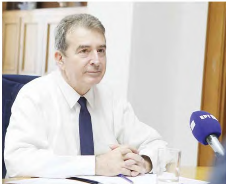
Ο νέος υπουργός Υγείας θα βρίσκεται σήμερα στις 9 το πρωί στο ΠΑΓΝΗ και στις 11:30 θα συναντηθεί με τη διοίκηση του Βενιζελείου.

■ "Φρένο" σε αποφάσεις της διοίκησης του ΠΑΓΝΗ θα ζητήσουν οι εργαζόμενοι από τον υπουργό Υγείας