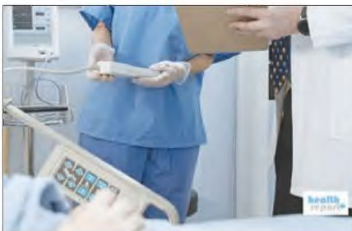
Καθυστέρηση παρατηρείται στα έργα για την ανακαίνιση των νοσοκομείων

καθυστερήσεις από την προηγούμενη ηγεσία του υπουργείου Υγείας, ενώ και πολλοί Διοικητές Νοσοκομείων δεν είχαν φροντίσει έγκαιρα να αποστείλουν τις καταστάσεις με τις ελλείψεις.