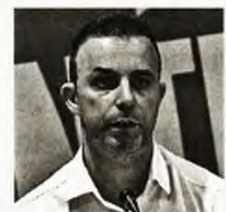
Ο υποψήφιος περιφερειάρχης Κεντρικής Μακεδονίας με τη «Λαϊκή Συσπείρωση», Σωτήρης Αβραμόπουλος

φέροντα (...) Με διακριτό το χαρακτηριστικό της ανανέωσης του ψηφοδελτίου και της παρουσίας ανθρώπων μέσα από τα σώματά του ιδιωτικού και δημοσίου τομέα, στο κίνημα των μικρών επαγγελματιών και αγροτών, στο φοιτητικό κίνημα, στο κίνημα των συνταξιούχων που όλο αυτό το διάστημα βρέθηκαν στην πρώτη γραμμή του αγώνα απέναντι στην αντιλαϊκή πολιτική, για τη βελτίωση της ζωής της κοινωνικής πλειοψηφίας στην Περιφέρειά μας».