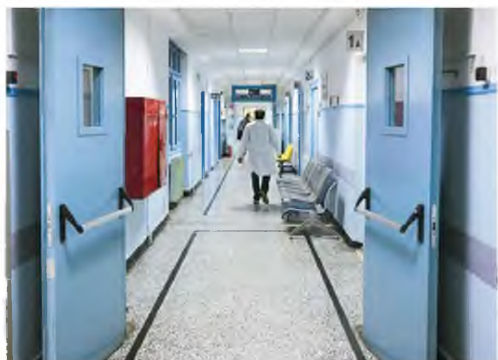
«Δέκα χιλιάδες εργαζόμενοι αποχώρησαν τα τελευταία 2,5 χρόνια από το ΕΣΥ», λέει ο πρόεδρος της ΠΟΕΔΗΝ Μιχάλης Γιαννάκος.