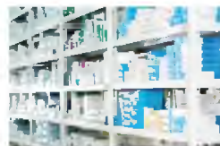
Οι φαρμακαποθήκες επισημαίνουν ότι αποτελούν τον βασικό πιστωτή της περιθαλψής.

Επιπλέον, επισημαίνουν ότι στη λίστα απαγόρευσης περιλαμβάνονται περισσότερα από 55 προϊόντα για τα οποία έχουν ενημερώσει τον ίδιο τον πρόεδρο αλλά και την αρμόδια υπηρεσία του ΕΟΦ ότι πλεονάζουν στα ράφια τους με κίνδυνο να λήξουν και διερωτώνται ποιον εξυπηρετεί η απαγόρευση εξαγωγής προϊόντων που είναι σε υπερεπάρκεια και για να τα πουλήσουν αναγκάζο-