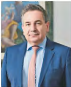
Ο πρόεδρος της Εθνικής Αρχής Ιατρικώς Υποβοηθούμενης Αναπαραγωγής Νικόλαος Βραχνιάς

Στον απόηχο του θορύβου που έχει προκαλέσει η υπόθεση εμπορίας ωαρίων στα Χανιά, η «Εφ.Συν.» φέρνει σήμερα στο φως ένα στοιχείο που προκαλεί πολλά ερωτήματα. Στη συγκεκριμένη κλινική, που σύμφωνα με την αστυνομία, αποτελούσε την έδρα ενός κυκλώματος εκμετάλλευσης ανθρώπων, είχε επιβληθεί ποινή ανάκλησης της άδειας για έξι μήνες αλλά και πρόστιμο στον ιδιοκτήτη της (σήμερα βασικό κατηγορούμενο).