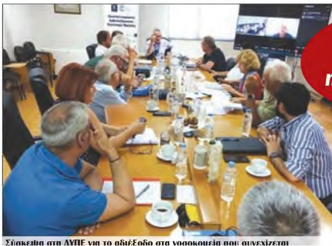
Σύσκεψη στη ΔΥΠΕ για το αδιέξοδο στα νοσοκομεία που συνεχίζεται

Γνωστά κυβερνητικά μέτρα, με εξαίρεση αυτό των προσλήψεων συνταξιούχων γιατρών, ανακοίνωσε χθες η Διοίκηση της ΔΥΠΕ Κρήτης για την προσέλκυση γιατρών στα νοσοκομεία του νησιού, με οικονομικά και άλλα κίνητρα, τα οποία μέχρι σήμερα πάντως δεν έχουν αποδώσει. Τα αδιέξοδα που έχουν δημιουργηθεί στα νοσοκομεία του νησιού με τα “εντέλλεσθε”, δηλαδή τις υποχρεωτικές μετακινήσεις γιατρών από νοσοκομείο σε νοσοκομείο, τα εξώδικα, τις παραιτήσεις, την επικινδυνότητα στη λειτουργία τμημάτων, για την οποία έχουν ενημερωθεί οι εισαγγελικές Αρχές, ήταν το αντικείμενο ευρείας σύσκεψης που πραγματοποιήθηκε χθες στην 7η ΥΠΕ, παρουσία των διοικητών των νοσηλευτικών ιδρυμάτων και των 5 προέδρων των Ιατρικών Συλλόγων του νησιού. Η συζήτηση έγινε σε μια πολύ καθυστερημένη προσπά-