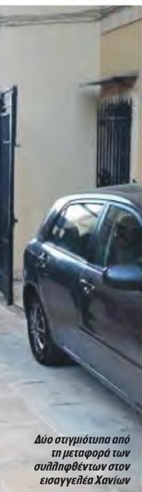
Δύο συγγράμματα από τη μεταφορά των συλληφθέντων στον εισαγγεφέα Χανίων