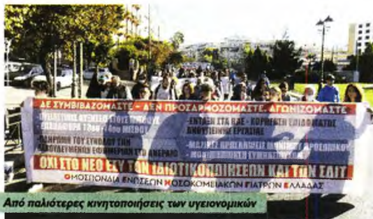
Από παλιότερες κινητοποιήσεις των υγειονομικών

Απαιτεί την ακύρωση των σχετικών ενεργειών της