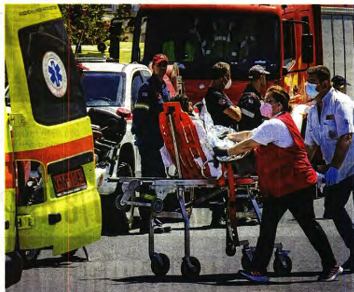
i Οι ιατρικοί σύλλογοι ζητούν την άμεση στελέχωση των ασθενοφόρων του ΕΚΑΒ με επαγγελματίες οδηγούς και διασώστες

Σύμφωνα με τους υγειονομικούς, το Γενικό Νοσοκομείο Αρτας, συγκεκριμένα το απεικονιστικό εργαστήριο του νοσοκομείου , αντιμετωπίζει σημαντικό πρόβλημα υποστελέχωσης, γεγονός που οδηγεί το προσωπικό