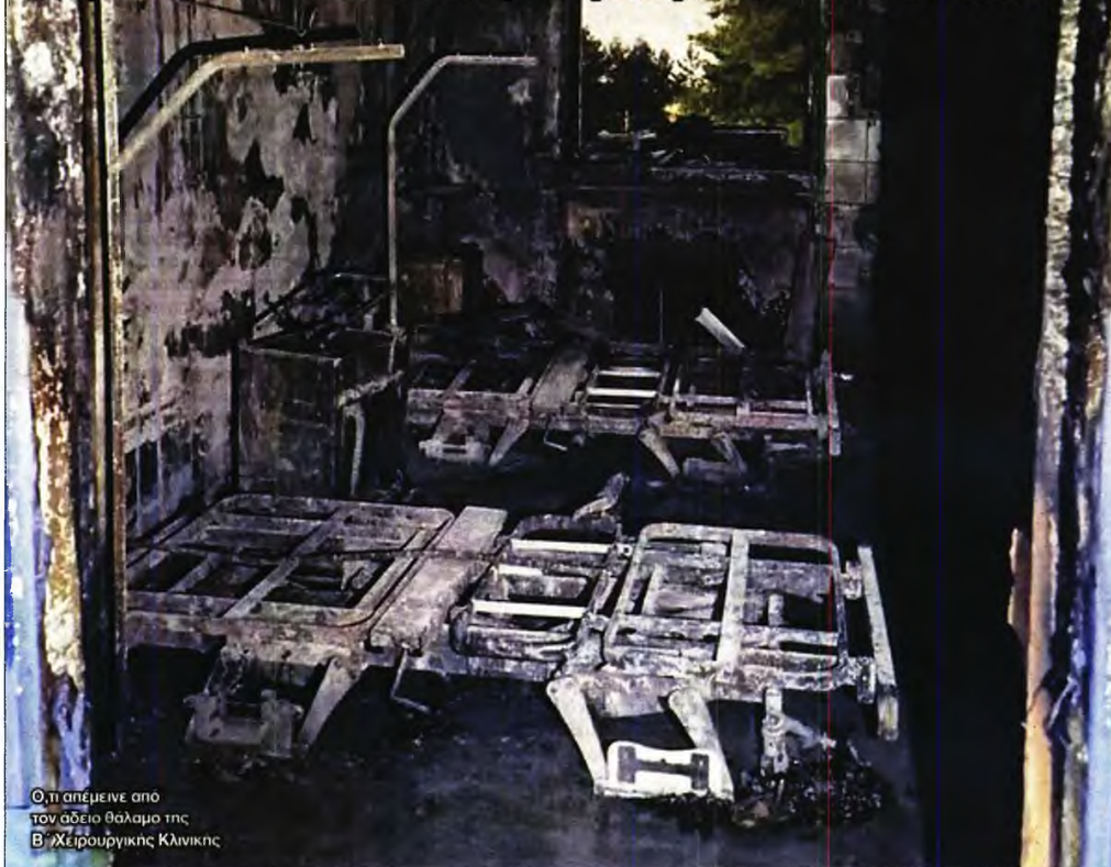
Ο,τι απέμεινε από τον άδειο θάλαμο της Β' Χειρουργικής Κλινικής

Πυρκαγιά ξέσπασε χθες στις 2.30 τα ξημερώματα στο Γενικό Νοσοκομείο Νίκαιας «Άγιος Παντελεήμων», ευτυχώς χωρίς θύματα ή σημαντικές υλικές ζημιές.