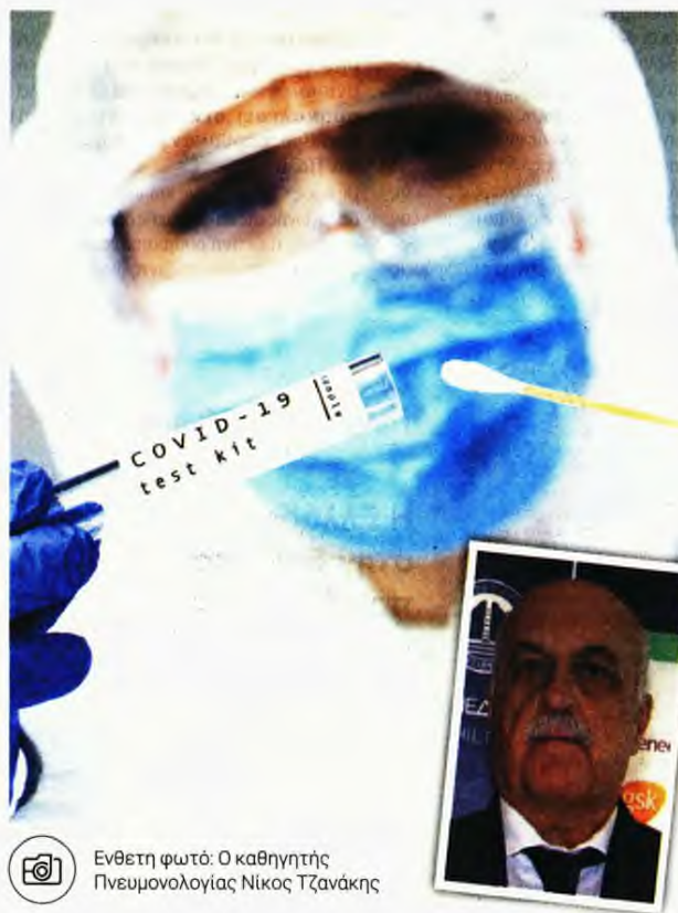
Ενθετη φωτο: Ο καθηγητής Πνευμονολογίας Νίκος Τζανάκης

Όσο για την ανοσία κατά του κορονοϊού, ο καθηγητής Πνευμονολογίας είπε ότι σαφώς έχει μειωθεί, όμως υπάρχει σχετική «μνήμη» στον ανθρώπινο οργανισμό, «καθώς τα κύτταρά μας, η άμυνά μας και τα λεγόμενα κύτταρα μνήμης θυμούνται ότι αυτός δεν είναι καλός τύπος που μπαίνει στο σώμα μας και κάπως αντιδρούν», συμπληρώνοντας ότι δεν είμαστε «γυμνοί», όπως το 2020, πριν βγουν τα εμβόλια.