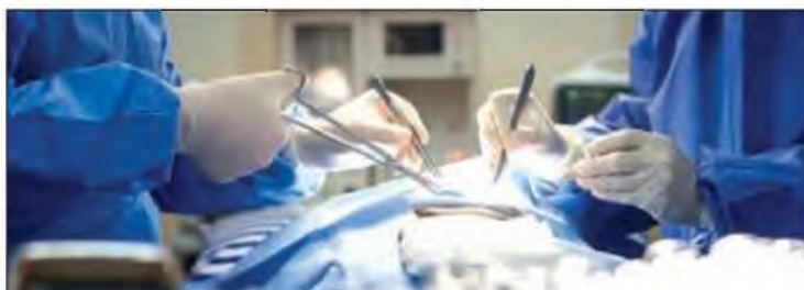
«Φέρτε μας 2 αναισθησιολόγους, αλλιώς σταματάμε τα τακτικά χειρουργεία», λένε οι χειρουργοί

“Λόγω της επικείμενης παραίτησης του αναισθησιολόγου κ. Ανδρουλάκη, μετά τις 10 Σεπτεμβρίου το Αναισθησιολογικό τμήμα δεν μπορεί να υποστηρίξει 3 αίθουσες χειρουργείου και συνεπώς συνεχι-