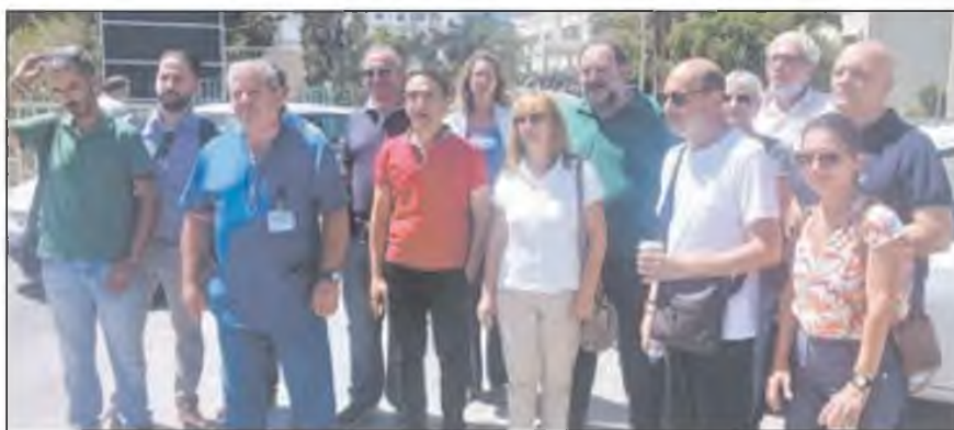
Εργαζόμενοι από όλη την Κρήτη μετέφεραν μια τραγική εικόνα υποβάθμισης σε όλες τις δημόσιες δομές υγείας του νησιού

Εκλεγμένοι εκπρόσωποι από τα ΔΣ των συλλόγων/ενώσεων μετέφεραν εικόνα από την τραγική υποβάθμιση των νοσοκομείων, των ΚΥ και του ΕΚΑΒ εξαιτίας της χρόνιας υποστελέχωσης. Όλοι σχεδόν επέστησαν την προσοχή στον κίνδυνο να αναστείλουν τη λειτουργία τους βασικά τμήματα και κλινικές και να καταρρεύσουν ολόκληρες μονάδες υγείας μετά το κύμα παραιτήσεων υγειονομικών. Εκφράστηκε επίσης η αγανάκτηση για τις εξουθενωτικές συνθήκες δουλειάς, που οδηγούν στις παραιτήσεις, επιδεινώνοντας τα προβλή-