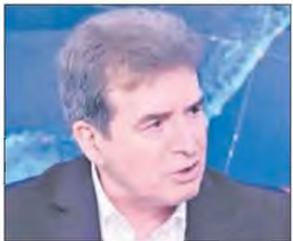
Ο υπουργός Υγείας Μιχάλης Χρυσχοϊδης

Το ΕΣΥ είναι σε οριακό σημείο και οι γιατροί πρέπει να βάλουν πλάτη. Αυτό ανέφερε, μεταξύ άλλων ο Μιχάλης Χρυσχοϊδης στη συνάντηση που είχε την περασμένη Πέμπτη με το προεδρείο της Ένωσης Ιατρών Νοσοκομείων Αθήνας - Πειραιά (ΕΙ-ΝΑΠ). Είπε μάλιστα ότι είναι ανήθικο να σε σπουδάξει το κράτος και μετά να πηγαίνει για δουλειά στον ιδιώτη.