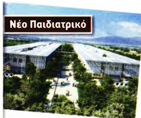
Ρεπορτάζ Βασίλης Βενιζέλος