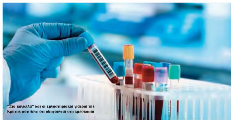
“Στα κάγκελα” και οι εργαστηριακοί γιατροί της Κρήτης που λένε ότι οδηγούνται στη χρεοκοπία

Την αυξημένη ζήτηση ο ΕΟΠΥΥ την καλύπτει με χρέωση των Εργαστηριακών ιατρών και όχι με δικό του αυξημένο προϋπολογισμό ως οφείλει. Αποτέλεσμα πλέον και μετά την εκτίναξη της δαπάνης κατά την διάρκεια της πανδημίας, αλλά και στον απόηχο της, (χρόνια νοσήματα που παραμελήθηκαν, εξάρσεις νοσημάτων πλην του κοροναϊού από τα νοσοκομεία , επιπτώσεις Long Covid) να εκτο-