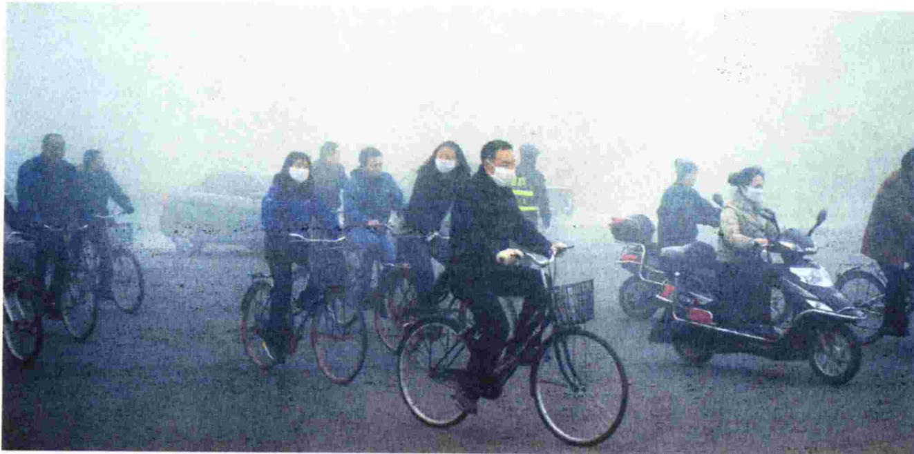
ΑΝΗΣΥΧΙΑ προκαλεί το γεγονός ότι στην παρούσα μελέτη εξετάστηκαν τα μικροσκοπικά αιωρούμενα σωματίδια στην ατμόσφαιρα και όχι οι ρύποι από την καύση ορυκτών καυσίμων

ΕΡΕΥΝΑ ΕΠΙΣΤΗΜΟΝΩΝ ΑΠΟ Ν. ΖΗΛΑΝΔΙΑ, ΗΠΑ ΚΑΙ ΣΟΥΗΔΙΑ