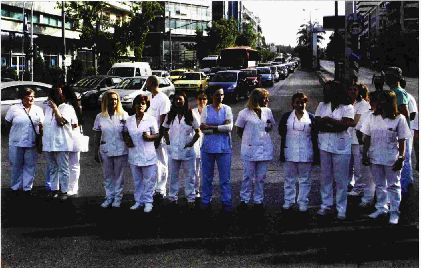
Εργαζόμενοι του νοσοκομείου Ερυθρός Σταυρός έχουν αποκλείσει συμβολικά την Κηφισιά σε παλαιότερη κινητοποίησή τους

Ρεπορτάζ Ρίτα Μελλά rmeta@dimokratianews.gr