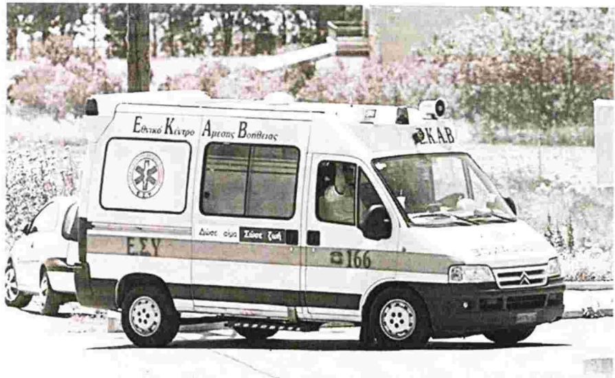
Οι τρεις τραυματίες διακομίστηκαν στο Κέντρο Υγείας Βάρδας και στο Γενικό Νοσοκομείο Πύργου

Σύμφωνα με πληροφορίες η νεκρή γυναίκα που είναι υπήκοος Αλβανίας, είχε κατευθυνση προς Αμαλιάδα, όπου πήγαινε για μεροκάματο ως μικροπωλήτρια στην λαϊκή αγορά. Στο αυτοκίνητο επέβαινε η 39χρονη αδερφή της, ο 12χρονος γιος της, και ένας 24χρονος. Ελαφρά τραυματίστηκαν η 39χρονη και ο 24χρονος. Το παιδί έχει υποστεί σοκ, καθώς είδε τη μητέρα του να χάνεται μπροστά στα μάτια του. Προανάκριση για το τροχαίο διενεργεί το ΑΤ Αμαλιάδος.