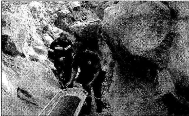
Στα 40 μέτρα βάθος η «βουτιά θανάτου» του μικρού αγοριού

Σύμφωνα με πληροφορίες, την ώρα του δυστυχήματος ο 9χρονος βρισκόταν ακριβώς πίσω από τον πατέρα του περνώντας το δυσκολότερο σημείο της διαδρομής ενώ πιο μπροστά περπατούσε η μητέρα του. Δηλαδή, αμφότεροι οι γονείς προπορεύονταν επομένως δεν ήταν σε θέση να προσέχουν τις κινήσεις του ούτε είχαν συνεχή οπτική επαφή μαζί του. Σύμφωνα με τα όσα δήλωσαν οι ίδιοι «μέσα σε μερικά δευτερόλεπτα το έχασαν από το οπτικό τους πεδίο». «Ίσως οι γονείς είχαν μεγάλη εμπιστοσύνη στα παιδιά τους και τα άφησαν πίσω τους στη διάρκεια της πεζοπορίας. Αλλά στο συγκεκριμένο σημείο, αν πέσεις, επιστροφή δεν έχει. Ντόπιιοι λένε ότι στην περιοχή αυτή έχουν καταπέσει και άλλα, δεκάδες, άτομα, που δεν βρέθηκαν τελικά ποτέ, αφού τα νερά φτάνουν κατά τόπους ακόμα και σε