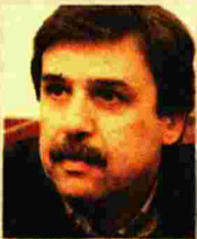
»»» Ο υπουργός Υγείας, Ανδρέας Ξανθός.

Κάποιοι υποστηρίζουν ότι ο κ. Πολάκης διατηρεί άριστες σχέσεις με το Μαξίμου και θα παραμείνει ακλόνητος στο πόστο του. Ορισμένοι, ωστόσο, θεωρούν ότι αυτό μένει να αποδειχτεί στον προσεχή ανασχηματισμό.