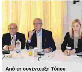
Από τη συνέντευξη Τύπου.