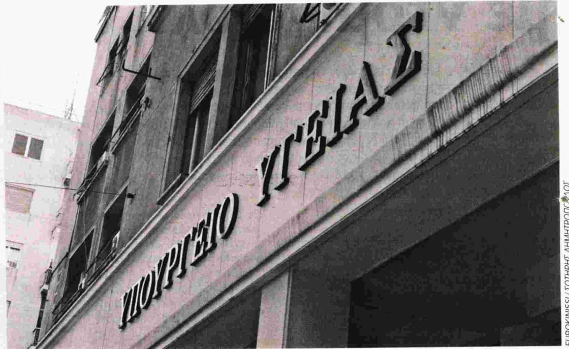
ΕΥΡΟΚΙΝΗΣΗ / ΣΩΤΗΡΗΣ ΔΗΜΗΤΡΟΠΟΥΛΟΣ

Την ανεμπόδιστη πρόσβαση όλων των ανθρώπων στο δημόσιο σύστημα Υγείας ζητούν τα αυτοοργανωμένα Κοινωνικά Ιατρεία και Φαρμακεία του Ιλίου, της Ν. Φιλαδέλφειας, της Ν. Χαλκηδόνας, της Πατησίων/Αχαρνών, της Ν. Σμύρνης και της Σαλαμίνας με κινητοποίησή τους αύριο στις 11.30 έξω από το υπουργείο Υγείας