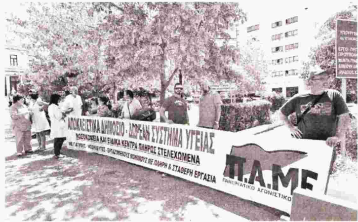
Το πανό του ΠΑΜΕ έξω από το «Ιπποκράτειο»

Κ ινητοποίηση στο υπουργείο Υγείας έκαναν χτες το πρωί εργαζόμενοι στα δημόσια νοσοκομεία , στο πλαίσιο στάσης εργασίας (11 π.μ. - 3 μ.μ.). Τα προβλήματα υγειονομικών και ασθενών είναι εκρηκτικά, όπως και η κατάσταση που επικρατεί στις δημόσιες μονάδες Υγείας από τις ελλείψεις προσωπικού, φαρμάκων, υλικών, υποδομών, ιατροτεχνολογικού εξοπλισμού.