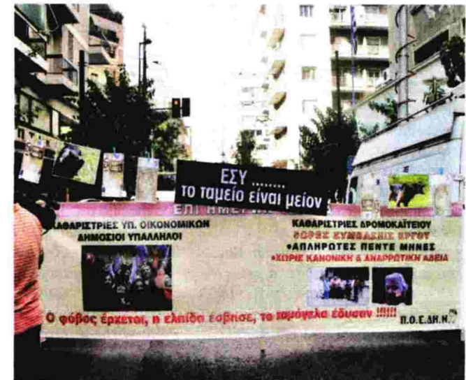
Το διχαστικό πανό της ΠΟΕΔΗΝ

Αποκορύφωμα, ένα εξαιρετικά προβληματικό πανό, που εικόνιζε από τη μία τις αγωνιζόμενες καθαρίστριες του υπουργείου Οικονομικών ως «δημόσιες υπαλλήλους» που βολεύτηκαν και από την άλλη τις απλήρωτες καθαρίστριες στο Δρομοκαίτειο. Για απαράδεκτο και αντιδραστικό πανό που διασπά τους εργαζομένους και συσκοτίζει την ουσία έκαναν λόγο οι δυνάμεις του ΠΑΜΕ στην ΠΟΕΔΗΝ, κατηγορώντας την πλειοψηφία της ΠΟΕΔΗΝ για πρακτικές εκφυλισμού και αποπροσανατολισμό των εργαζομένων. A.TZ.