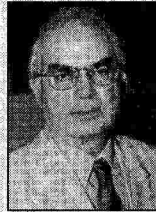
Του Δημήτρη Α. Στεργίου

Σύμφωνα με την έκθεση αυτή, η Ελλάδα για το 2009 έπεσε στην 24η θέση μεταξύ 33 χωρών σε ό,τι αφορά την αξιολόγηση του ΕΣΥ από τους ίδιους τους καταναλωτές,