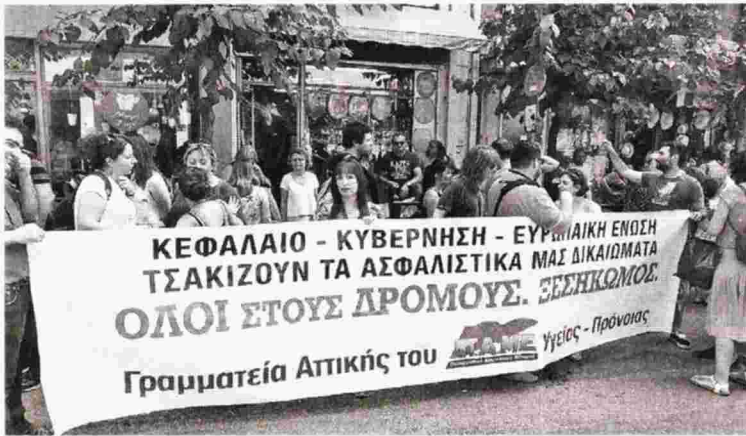
Από τη χτεσινή κινητοποίηση έξω από το υπουργείο Υγείας

Εκφυλισμός, αθώωση των ενόχων και διάσπαση των εργαζομένων από την πλειοψηφία της ΠΟΕΔΗΝ