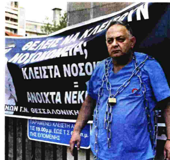
Ο πρόεδρος των εργαζομένων στο «Αγιος Δημήτριος» αλυσοδεμένος στα κάγκελα του «Ιπποκράτειου»

Νωρίτερα είχε βρεθεί αντιμέτωπος με παράσταση διαμαρτυρίας στο Ιπποκράτειο Νοσοκομείο Θεσσαλονίκης στο πλαίσιο της τετράωρης στάσης εργασίας που είχαν κηρύξει οι νοσοκομειακοί