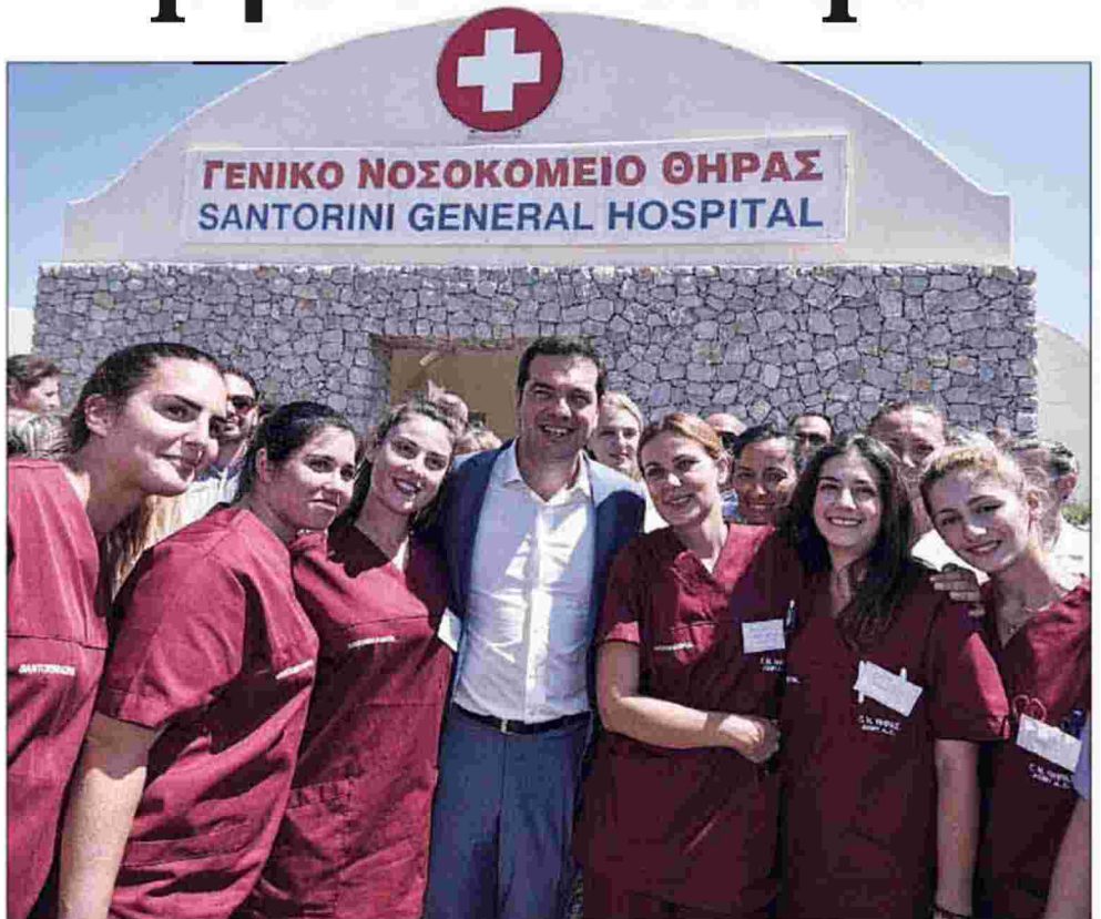
Ο πρωθυπουργός Αλέξης Τσίπρας φωτογραφήθηκε με το προσωπικό του Νοσοκομείου Θήρας

Αυτό είναι το πόρισμα της «αυτοψίας» που πραγματοποίησε κλιμάκιο της Πανελληνίας Ομοσπονδίας Εργαζομένων Δημόσιων Νοσοκομείων, όπως εξηγήει στη «δημοκρατία» ο πρόεδρος της Μιχάλης Γιαννάκος. Σύμφωνα με τον ίδιο, το... ποδαρικό συνοδεύτηκε από παράπονα και διαμαρτυρίες των 100 εργαζο-