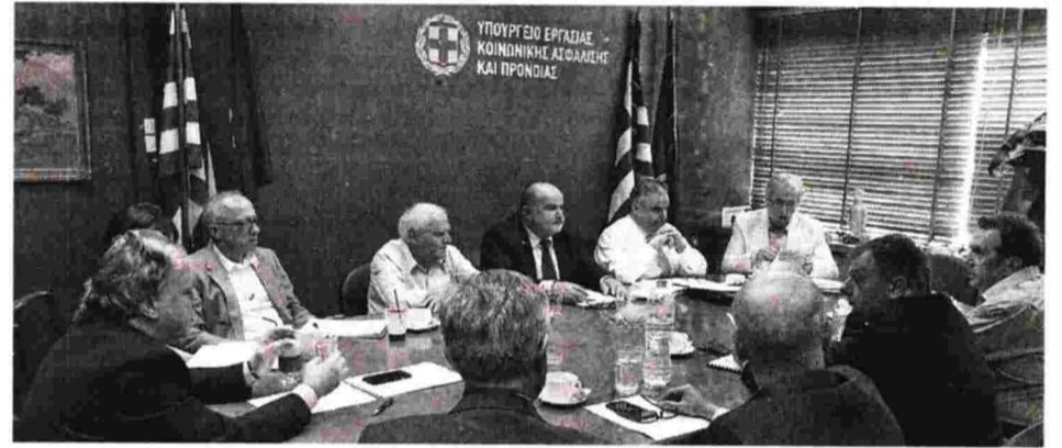
Από την προηγούμενη συνάντηση του Γ. Κατρούγκαλου με τους «κοινωνικούς εταίρους»

την αντιμετώπιση πρακτικών κακής εφαρμογής του, χωρίς όμως να τίθεται σε αμφισβήτηση το δικαίωμα στην απεργία και στη συνταγματική προστασία συνδικαλιστικής δράσης.