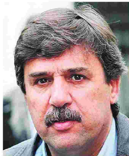
Ο υπουργός Υγείας δεσμεύτηκε ότι το Σεπτέμβριο θα πραγματοποιήσει συνάντηση με το γενικό γραμματέα Δημόσιας Υγείας Γιάννη Μπασκόζο, την Κοινωνία των Πολιτών και γιατρούς των ΜΕΛ, προκειμένου να σχεδιαστεί μία ολοκληρωμένη στρατηγική αντιμετώπισης και επίλυσης όλων των προβλημάτων.

Τα παραπάνω προβλήματα παρουσίασαν οι εκπρόσωποι του Κέντρου