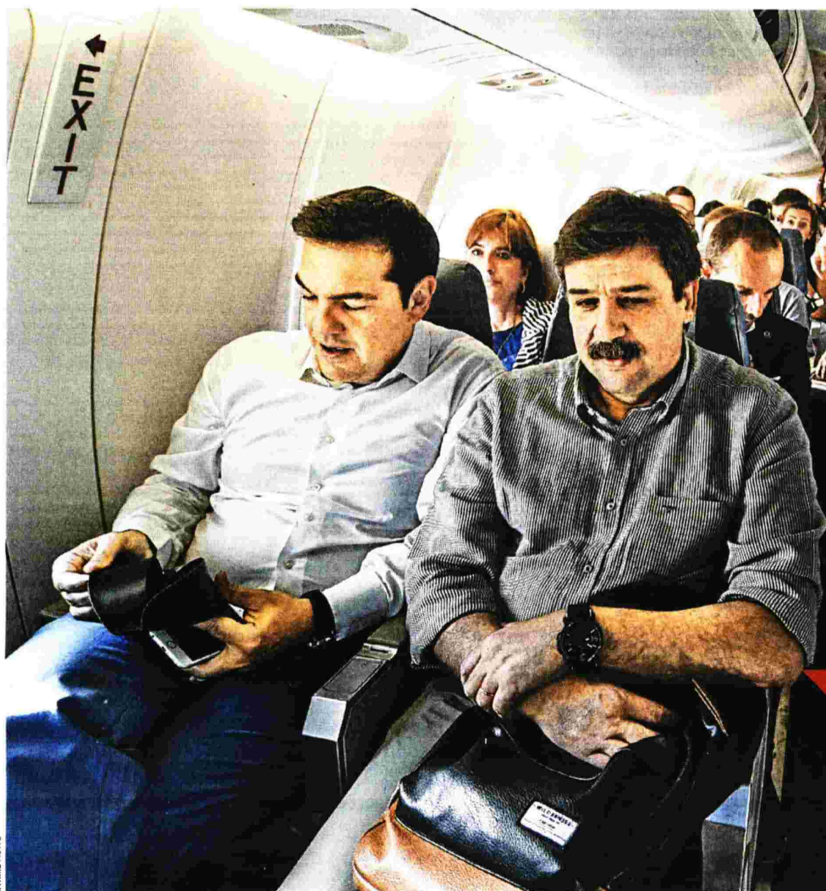
Μόλις στις 15 Ιουλίου ο Πρωθυπουργός και η ηγεσία του υπουργείου Υγείας είχαν πετάξει στο νησί της Σαντορίνης για τα εγκαίνια του νοσοκομείου. Οι ιθύνοντες της οδού Αριστοτέλους στρέφονται τώρα στο plan B προκειμένου να καλυφθούν άμεσα τα κενά της νοσηλευτικής μονάδας

Στο νοσοκομείο της Λήμνου δεν υπηρετεί σε καθημερινή βάση αναισθησιολόγος, ενώ η νοσηλευτική μονάδα διαθέτει μεν παθολογική κλινική αλλά ούτε έναν διορισμένο παθολόγο.