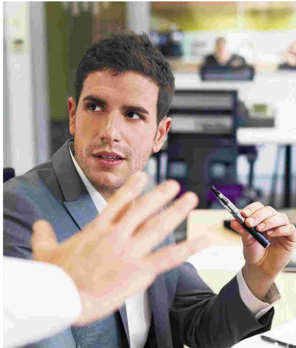
Σύμφωνα με έρευνες που επικαλέστηκε ο κ. Ξανθός, η χρήση ηλεκτρονικού τσιγάρου είναι πύλη εισόδου για τον εθισμό στη νικοτίνη και εξάρτησης στη συμπεριφορά.

Στη συνέντευξή του ο Ανδρέας Ξανθός τόνισε ότι στόχος του υπουργείου Υγείας είναι να αλλάξει η κουλτούρα γύρω από το κάπνισμα και άφησε ανοικτό το ενδεχόμενο να αρχίσουν να αποζημιώνονται ξανά από τα Ταμεία τα φάρμακα που συμβάλλουν στη διακοπή του καπνίσματος. Ο υπουργός σημειώνει ότι δεν συμφωνεί με την αύξηση της τιμής των τσιγάρων, παρότι δέχεται σχετικές εισηγήσεις. ■