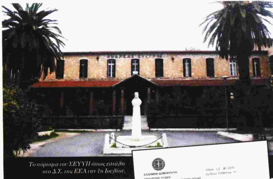
Το πόρτιομα του ΣΕΥΥΠ όπως εστάθη στο Δ.Σ. της ΕΕΑ την 1η Ιουλίου.

και επιτροπή καταστροφής άχρηστου υλικού. Πολλές εισαγωγές γίνονται δε με εντολή του προέδρου (του υπόδικου για κακουργήματα αρχιμανδρίτη Προκόπιου Μπούμπα) και εγκρίνονται εκ των υστέρων από το Δ.Σ. στο τέλος του έτους.