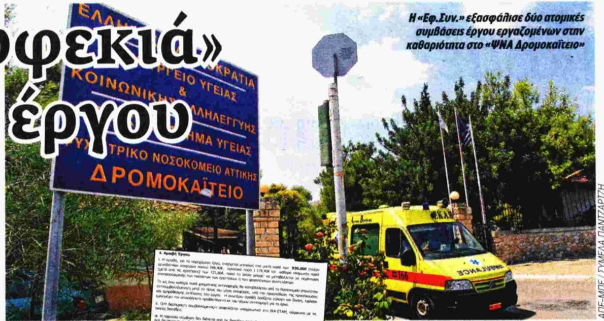
Η «Εφ.Συν.» εξασφάλισε δύο ατομικές συμβάσεις έργου εργαζομένων στην καθαριότητα στο «ΨΝΑ Δρομοκαΐτειο»

Με τις ατομικές συμβάσεις έργου καταργούνται εργατικά δικαιώματα όπως ο 13ος και 14ος μισθός, το επίδομα άδειας, η άδεια εγκυμοσύνης, τα επιδόματα για Βαρέα και Ανθυγιεινά, η κανονική και αναρρωτική άδεια