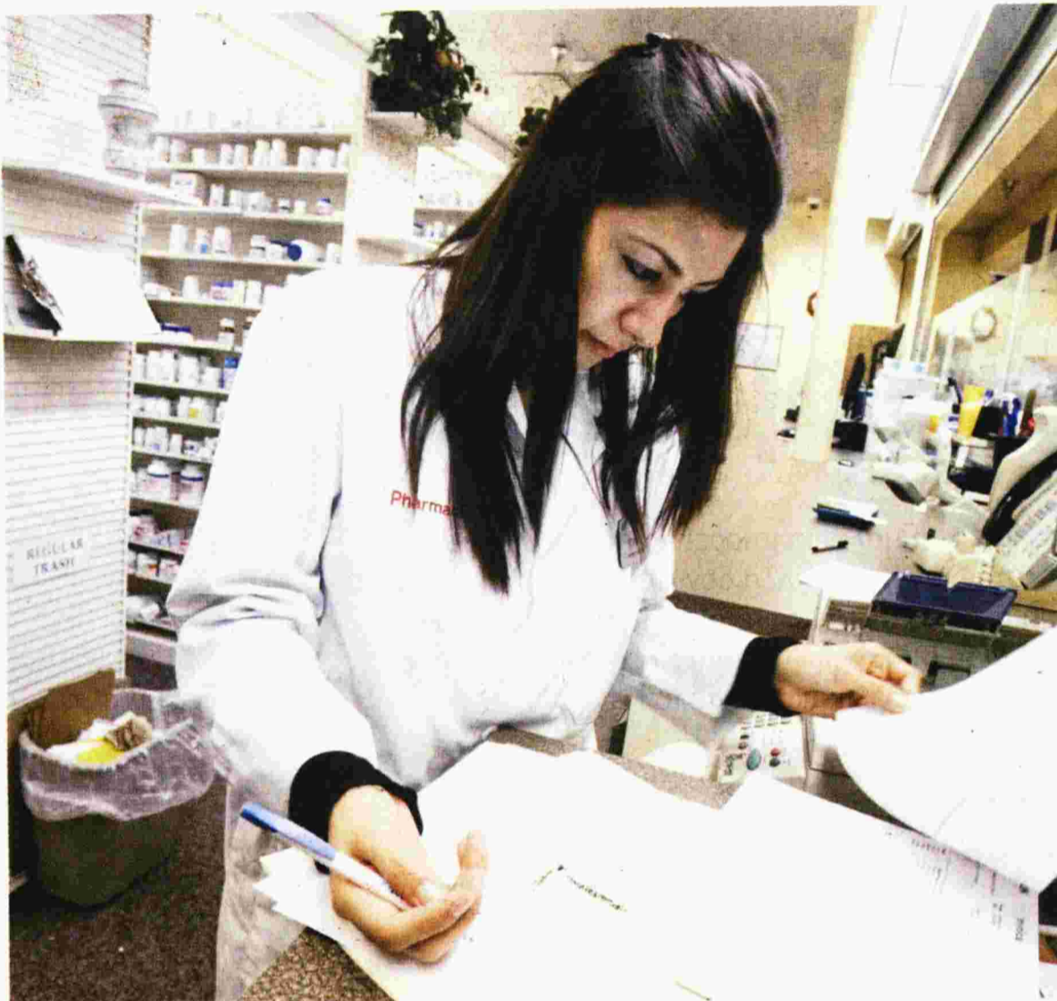
ΤΟ ΠΟΡΙΣΜΑ της αρμόδιας υπηρεσίας ελέγχου φέρνει στο φως παραβάσεις από το σύνολο των παρόχων του ΕΟΠΥΥ. Περιλαμβάνει, δε, πλήθος αναφορών για τον κλάδο των φαρμακοποιών (φωτογραφία αρχείου)

Το πόρισμα, ωστόσο, της αρμόδιας υπηρεσίας ελέγχου (ΥΠΕΔΥΦΚΑ) φέρνει στο φως σειρά παραβάσεων από το σύνολο των παρόχων του ΕΟΠΥΥ. Περιλαμβάνει, δε, πλήθος αναφορών για τον κλάδο των φαρμακοποιών. Κατά τους ελέγχους σε φαρμακεία, έχει εντοπιστεί εικονική εκτέλεση συνταγών, παράνομη εξαγωγή και πώληση φαρμάκων, εκτέλεση συνταγών μετά τον θάνατο των ασφαλισμένων και παράτυπη διακίνηση σκευασμάτων, τα οποία εντάσσονται στον περιορισμό διάθεσης περί ναρκωτικών ουσιών. Οι ελεγκτές βρήκαν, επίσης, σε φαρμακεία κουπόνια φαρμάκων και αναλώσιμων υλικών, σκευάσματα χωρίς κουπόνια τα οποία είχαν χρεωθεί και αποζημιωθεί από τον ΕΟΠΥΥ. Εντόπισαν, επίσης, βιβλι-