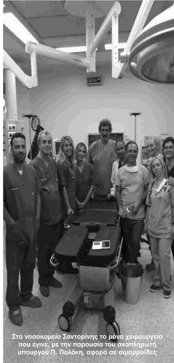
Στο νοσοκομείο Σαντορίνης το μόνο χειρουργείο που έγινε, με την παρουσία του αναπληρωτή υπουργού Π. Πολάκη, αφορά σε αιμορροΐδες

Οι υπουργοί Υγείας λιγόστεψαν το προσωπικό του ΕΣΥ κατά 4.000. Οι κενές οργανικές θέσεις στα νοσοκομεία είναι 35.000. Η Πρωτοβάθμια Περίθαλψη διαλύθηκε. Οι πολίτες από την τσέπη τους πληρώνουν την ιατροφαρμακευτική περίθαλψη. Δεν χρησιμεύει σε τίποτα πια το βιβλιάριο ασθενείας, αν και πληρώνουμε αδρά για υγειονομική περίθαλψη. Τα Κέντρα Υγείας μαζεύουν τα συντρίμια τους και το προσωπικό μετακινείται για να καλύψει τα τεράστια κενά σε άλλες Πρωτοβάθμιες Μονάδες ή τα Νοσοκομεία. Τα Ψυχιατρικά Νοσοκομεία βαίνουν προς κατάρρευση και Δημόσια Ψυχική Υγεία παραδίδεται σε ιδιώτες επιχειρηματίες» αναφέρει.