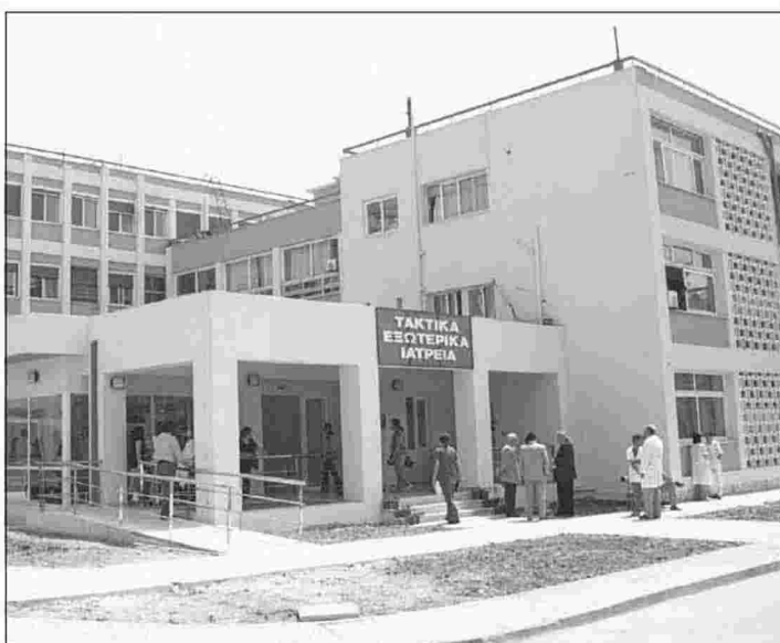
■ Στο Νοσοκομείο «Γεννηματάς» υπάρχουν μεγάλες ελλείψεις σε προσωπικό, όπως και σε ιατρούς χειρουργούς

Η πραγματικότητα, όπως την παρουσιάζει η ΠΟΕΔΗΝ, είναι πως οι ασθενείς, κατά την εισαγωγή τους στο νοσοκομείο, καλούνται να αγοράζουν τά υλικά που θα καταναλώσουν, ενώ τα νοσοκομεία, τα Κέντρα Υγείας και το ΕΚΑΒ συντηρούνται με εράνους, δωρεές-προσφορές τοπικών φορέων, καθώς οι ληξιαρχείοσμοσ δφειλές