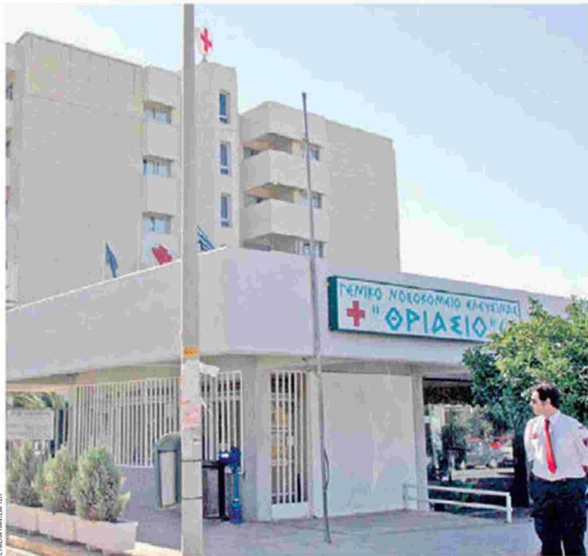
Κενές είναι σχεδόν οι μισές οργανικές θέσεις νοσηλευτικού προσωπικού στο «Θριάσιο».

«Τα νοσοκομεία, τα κέντρα υγείας, το ΕΚΑΒ είναι υπό διάλυση», σημειώνει η ΠΟΕΔΗΝ, που επιτίθεται για άλλη μία φορά στον πρωθυπουργό κ. Τσίπρα και στην ηγεσία του υπουργείου Υγείας, τονίζοντας ότι «σύντομα θα κληθούν να απολογηθούν για την καταστροφή του ΕΣΥ».