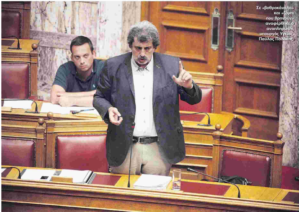
Σε «βοθροκάναλα» και «ζόμπι που θρηνούν» αναφέρθηκε ο αναπληρωτής υπουργός Υγείας, Παύλος Πολάκης.