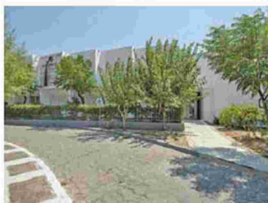
Ένα παλιό καταρρέον ξενοδοχείο μετετράπη στα κομψό Art Space, στο Πυθαγόρειο της Σάμου.

Ορισμένοι κάτοικοι, περισσότερο όμως ξένοι επισκέπτες—καθώς φαι-