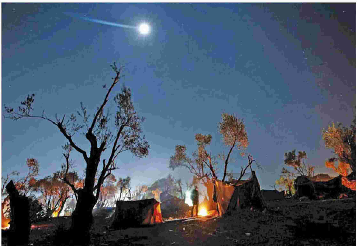
Στην έκθεση στο Art Space, που θα διαρκέσει μέχρι τις 15 Οκτωβρίου, βλέπει κανείς τις βραβευμένες με Πούλιτζερ φωτογραφίες του Γιάννη Μπεχράκη.