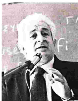
Η παράταξη του προέδρου του «Ιπποκράτη» επιφύλαξε επίθεση με σκληρές αναφορές στην ηγεσία του υπουργείου

«Η καλύτερη απάντηση στη μακροσκελή ανακοίνωση του κ. Πολάκη, την προηγούμενη εβδομάδα, όπου με περίσσεια θράσους - χολής και μένους καταφέρεται με διάφορες ασυναρτησίες και αοριστολογίες κατά των συνδικαλιστών και της ΠΟΕΔΗΝ, επειδή αναδεικνύουν τα προβλήματα των νοσοκομείων, σε ό,τι αφορά την περιοχή μας, πέρα από τις μεγάλες ελλείψεις στα νοσοκομεία μας και το ΧΑΟΣ με τις διοικήσεις επί 9 ολόκληρους μήνες, είναι η περίπτωση της ΔΩΡΕΑΣ του ακτινοθεραπευτικού μηχανήματος από το ίδρυμα Νιάρχου στο ΠΠΝΡΙΟΥ, μια δωρεά πολύ σημαντική και απαραίτητη και που δυστυχώς έφθασε στο σημείο να χαθεί, λόγω της αδιαφορίας της πολιτικής ηγεσίας του υπ. Υγεί-