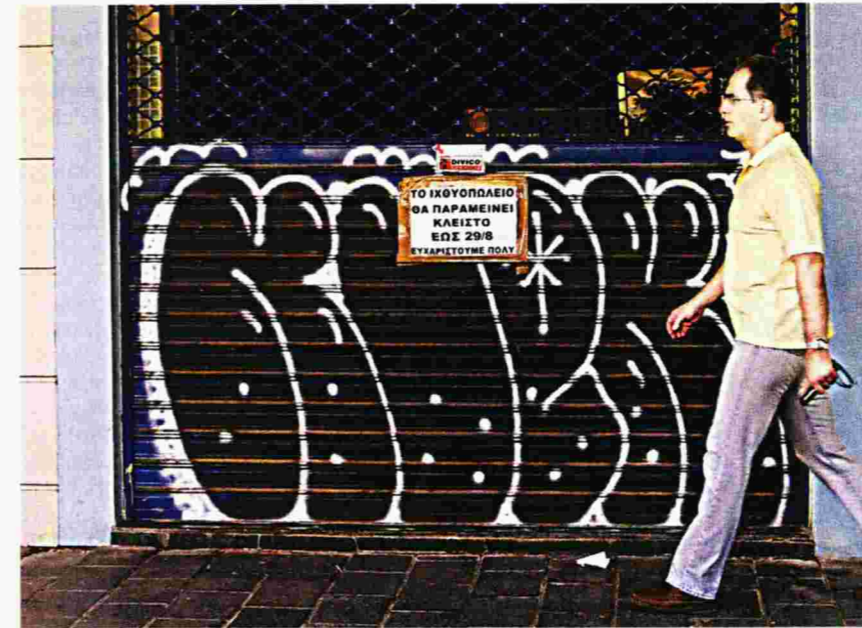
Είναι ένας τρόπος να πάρει άδεια το προσωπικό

ποσοστό, συνέπεια του ανταγωνισμού, οι ιδιοκτήτες τους προχωρούν σε ανακαινίσεις, προκειμένου να προσελκύσουν νέα πελατεία ή να διατηρήσουν την υφιστάμενη. Πρέπει να σημειωθεί ότι φέτος, εκτός από την απομάκρυνση των φοιτητών, το Πανεπιστήμιο της Πάτρας και άλλα ερευνητικά ιδρύματα παραμένουν κλειστά για ένα 20ήμερο τον Αύγουστο, καθώς η έλλειψη προσωπικού επέβαλε οι άδειες να δοθούν ομαδικά και οι υπηρεσίες να βάλουν «λουκέτο». Το ίδιο συμβαίνει και σε άλλες δημόσιες υπηρεσίες, πλην του τομέα υγείας, δηλαδή τα δύο μεγάλα νοσοκομεία και η ιατρεία του ΕΟΠΥΥ.