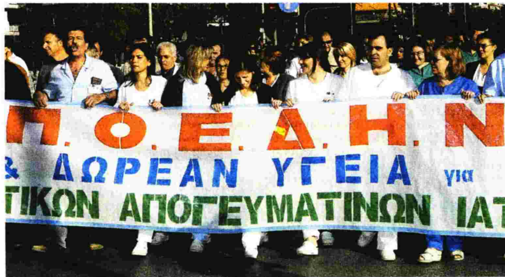
Δυναμικά στους δρόμους οι νοσοκομειακοί γιατροί

Σύμφωνα μάλιστα με την ΠΟΕΔΗΝ, «επί των ημερών Τσίπρα - Ξανθού - Πολάκη στα νοσοκομεία προσελήφθησαν 450 υπάλληλοι και μόνο. Εκ των 950 θέσεων που είχαν εγκριθεί από την προπροηγούμενη κυβέρνηση». «Οι υπόλοιπες 500 θέσεις», συνεχίζουν οι εργαζόμενοι στα δημόσια νοσοκομεία, «πολύ δύσκολα θα καλυφθούν, αν και οι υπουργοί Υγείας δεσμεύονταν για την πρόσληψη και των 950 υπαλλήλων