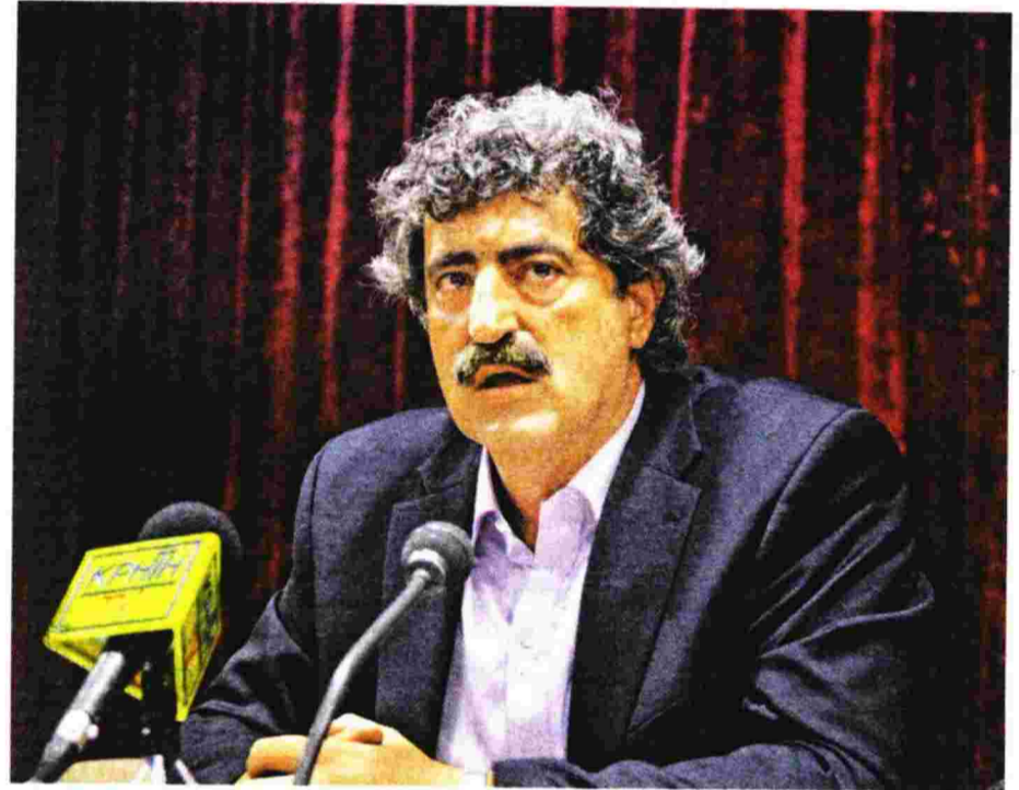
Απαντώντας στο δημοσίευμα της «Εφ.Συν.», ο αναπληρωτής υπουργός Υγείας Π. Παλάκης, παραθέτει σύμβαση εργαζόμενης από το Γενικό Νοσοκομείο Πατρών «Αγίος Ανδρέας» η οποία επιβεβαιώνει το δημοσίευμα της εφημερίδας

Το νομικό πλαίσιο, όπως εξηγούσε (δημοσίευμα 8.8.2016) ο Μιχάλης Γιαννάκος, πρόεδρος της Πανελλήνιας Ομοσπονδίας Εργαζομένων Δημοσίων Νοσοκομείων (ΠΟΕΔΗΝ), είναι σαθρό. Το άρθρο 97 του νόμου 4368/2016 «δεν θεσμοθετεί την υποχρεωτικότητα στις διοικήσεις των φορέων του υπουργείου Υγείας να εκδιώξουν τους εργολάβους, αλλά καθορίζει την προαιρετικότητα. Η σχετική διάταξη αναφέρει πως με απόφαση των διοικητικών συμβουλίων των φορέων είναι δυνατόν να συνάπτονται ατομικές συμβάσεις μίσθωσης για την κα-