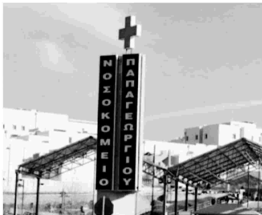
Το «Παπαγεωργίου» είναι το μόνο νοσοκομείο του ΕΣΥ στη Θεσσαλονίκη, όπου βρίσκεται σε πλήρη εξέλιξη η εφαρμογή της συγκεκριμένης τεχνικής. Μία τέτοια επέμβαση έχει πραγματοποιηθεί στο «ΑΧΕΠΑ», ενώ στον ιδιωτικό τομέα γίνεται στην κλινική «Άγιος Λουκάς».

«Το Μάρτιο του 2016 πήραμε τη σχετική άδεια και αρχίσαμε την εφαρμογή της νέας τεχνικής-επέμβασης διακαθετηριακής τοποθέτησης βιολογικών αορτικών βαλβίδων στο Νοσοκομείο Παπαγεωργίου. Είναι σε πλήρη ανάπτυξη και ήδη έγιναν οι πρώτες δέκα επιτυχείς εμφυτεύσεις. Στο πρόγραμμα αυτό μας συνεπικουρεί ιδιαίτερως με ένα πολύ υψηλό επιστημονικό επίπεδο ο καθηγητής Κωνσταντίνος Τούτουζας από το Ιπποκράτειο Νοσοκομείο Αθηνών, διότι έχουμε μία διαρκή επιστημονική συνεργασία με την πανεπιστημιακή καρδιολογική κλινική του νοσοκομείου αυτού», δηλώνει στη «Μ» ο υπεύθυνος του προγράμματος της διακαθετηριακής τοποθέτησης βιολογικών αορτικών βαλβίδων, πρόεδρος της Ομάδας