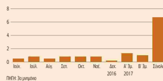
Χρονοδιάγραμμα αποπληρωμής χρεών του Δημοσίου (ποσά σε δισ. ευρώ)