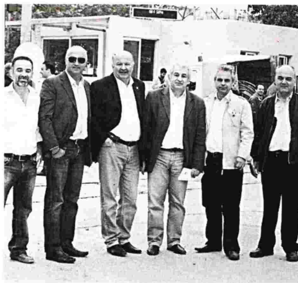
Η κατάσταση στον χώρο του Ιδρύματος είναι τεταμένη. Φωτ. Συνδικαλιστές του «Ιπποκράτη» σε προ ετών κινητοποίηση για το κτιριακό, που ακόμα δεν έχει λήξει. Η υπομονή έχει εξαντληθεί

Το Σωματείο αναμένεται να τονίσει επίσης τις ελλείψεις προσωπικού, την αδυναμία κάλυψης των βαρδιών, καθώς και τα προβλήματα στην ασφάλεια του νοσοκομείου. Κυρίαρχο θέμα είναι να βγει το «πλάνο» της μετακόμισης με τις κλινικές και τις κλίνες που θα μεταστεγαστούν στο 7ώροφο, εφόσον βέβαια επι-