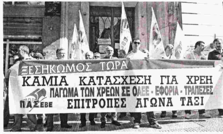
Από παλιότερη κινητοποίηση ενάντια στις κατασχέσεις και τους εκβιασμούς για χρέη στο Δημόσιο, στα Ταμεία και το κράτος

● Αύξηση της εισπραξιμότητας των ασφαλιστικών εισφορών ανά Ταμείο ως εξής: ΙΚΑ 95% (91% πέρσι), ΟΑΕΕ 65% (57% πέρσι), ΕΤΑΑ 80% (63%