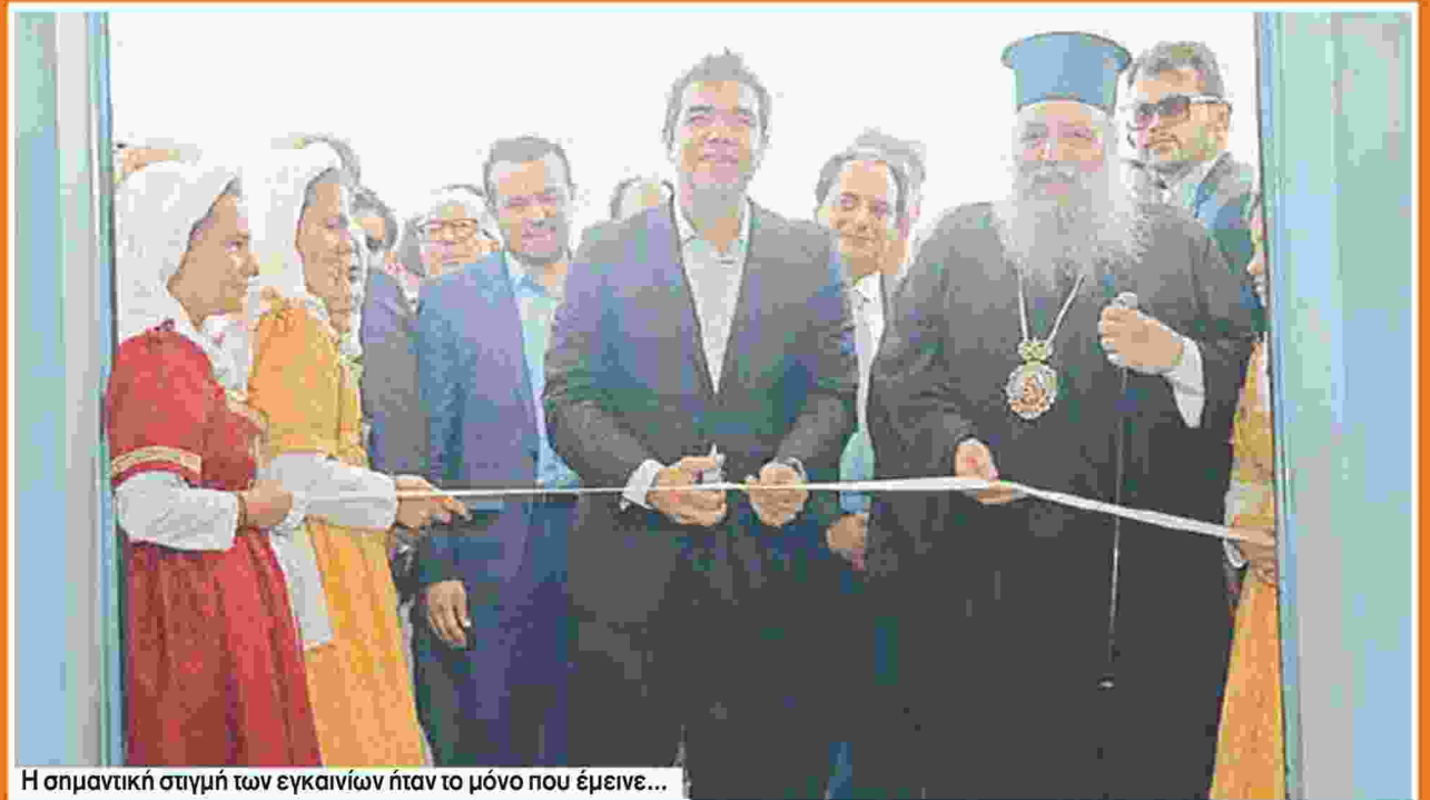
Η σημαντική στιγμή των εγκαινίων ήταν το μόνο που έμεινε...

Οι κάμερες έφυγαν, οι κορδέλες κόπηκαν, ωστόσο στον χώρο του νέου Αερολιμένας της Πάρου οι χιλιάδες τουρίστες