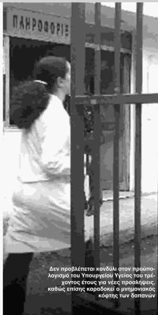
Δεν προβλέπεται κονδύλι στον προϋπολογισμό του Υπουργείου Υγείας του τρέχοντος έτους για νέες προσλήψεις, καθώς επίσης караδοκεί ο μνημονιακός κόφτης των δαπανών

Ο Σεπτέμβριος δεν θα μπει καθόλου καλά για την κυβέρνηση