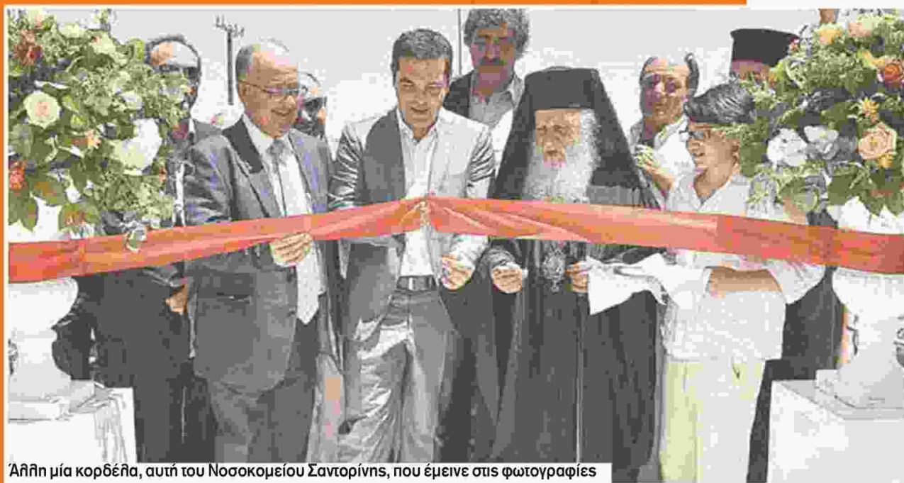
Άλλη μία κορδέλα, αυτή του Νοσοκομείου Σαντορίνης, που έμεινε στις φωτογραφίες

εικόνα που κρύβεται πίσω από τα λαμπερά φώτα τα οποία έριξαν στο Νοσοκομείο Σαντορίνης απλόχερα ο πρωθυπουργός και η ηγεσία του υπουργείου Υγείας, κατά τα εγκαίνιά του.