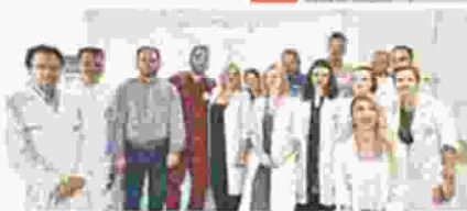
Το χαμόγελο του προσωπικού έχει παγώσει, μια και δεν μπορεί να βοηθήσει τους κατοίκους της Σαντορίνης