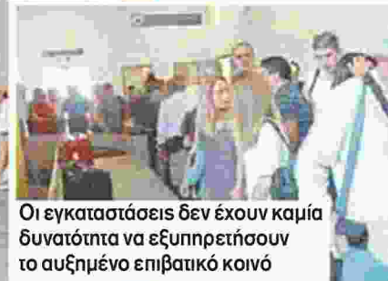
Οι εγκαταστάσεις δεν έχουν καμία δυνατότητα να εξυπηρετήσουν το αυξημένο επιβατικό κοινό

Το αεροδρόμιο της Πάρου μπορεί να εγκαινιάστηκε στις 29 Ιουλίου, όμως επιχειρησιακά δεν μπορεί να ανταπεξέθεται σε πτήσεις μεγάλων αεροσκαφών, μια και ο διάδρομος είναι μήκους μόλις 1.400 μέτρων