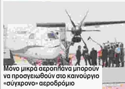
Μόνο μικρά αεροπλάνα μπορούν να προσγειωθούν στο καινούργιο «σύγχρονο» αεροδρόμιο