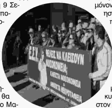
Ο Σεπτέμβριος δεν θα μπει καθόλου καλά για την κυβέρνηση