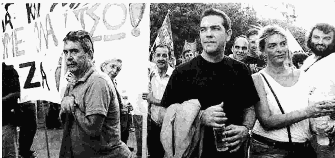
Από διαδηλωτής που υπήρξε πριν από μερικά χρόνια στη ΔΕΘ φέτος ο Αλέξης Τσίπρας ανεβαίνει για πρώτη φορά στην Έκθεση ως πρωθυπουργός και αναμένεται να βρεθεί σε κλοιό διαμαρτυρόμενων, ακόμη και πρώην συντρόφων του.

Σύμφωνα με τα έως τώρα δεδομένα η επίσκεψη του κ. Τσίπρα στη Θεσσαλονίκη θα είναι διήμερη. Θα φτάσει στην πόλη το πρωί του Σαββάτου 10 Σεπτεμβρίου και θα αναχωρήσει νωρίς το απόγευμα της Κυριακής. Η περίπτωση να έρθει από την Παρασκευή έχει σχεδόν αποκλειστεί, καθώς την ημέρα εκείνη πρόκειται να φιλοξενηθεί στην Αθήνα η σύνοδος των ηγετών των επτά μεσογειακών χωρών-μελών της Ευρωπαϊκής Ένωσης (Ελλάδα, Ιταλία, Γαλλία, Ισπανία, Πορτογαλία, Κύπρος, Μάλτα). Πάντως κυβερνητική πηγή άφησε ανοιχτό το ενδεχόμενο και για ένα «παράλληλο