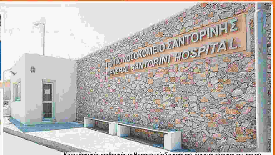
Καταπληκτικής αισθητικής το Νοσοκομείο Σαντορίνης, όμως οι κάτοικοι του νησιού εξακολουθούν να μην μπορούν να εξυπηρετηθούν, λόγω έλλειψης προσωπικού

κατά μέσο όρο 2,5 ώρες για κάθε διακομιδή από τη Σαντορίνη και έτσι γίνεται αντιληπτό πως σε λιγότερο από 10 ημέρες δαπανήθηκαν για διακομιδές πάνω από 100.000 ευρώ!