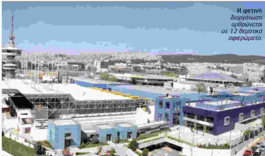
Η φετινή διοργάνωση αρθρώνεται σε 12 θεματικά αφιερώματα.

Εντατικές είναι στο μεταξύ οι προετοιμασίες τόσο των διοργα-