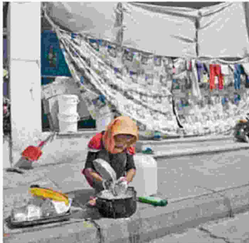
Η κατάσταση στον καταυλισμό προσφύγων στο Ελληνικό επιδεινώνεται. Προβλήματα υγιεινής, ακατάλληλες συνθήκες και έλλειμμα ασφάλειας παρουσιάζονται, όμως, και σε πολλές άλλες δομές φιλοξενίας.

Ο δήμαρχος Αργυρούπολης-Ελληνικού Γιάννης Κωνσταντάτος, που ζήτησε από το ΚΕΕΛΠΝΟ να παρέμβει, δηλώνει απογοητευμένος τόσο από το υπουργείο Μεταναστευτικής Πολιτικής όσο και από τους συναδέλφους του δημάρχους. «Από τον Μάιο ο κ. Μουζάλας υπόσχεται ότι θα αδειάσει το Ελληνικό και έφτασε Σεπτέμβρης. Οι άλλοι δήμοι της Αττικής κάνουν