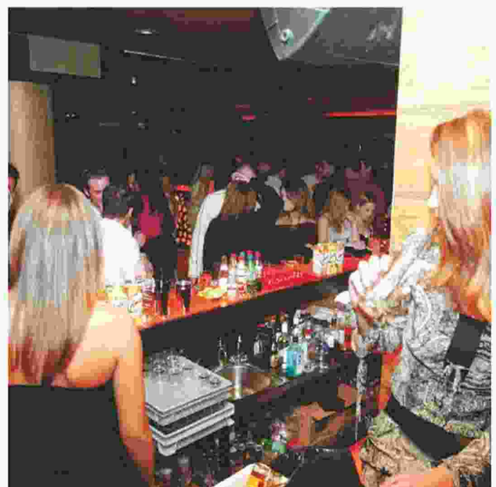
ΣΕ ΜΑΓΑΖΙΑ τα οποία ο πελάτης δεν γνωρίζει θα πρέπει να επιλέγει ποτά που είναι δύσκολο να νοθευτούν, όπως είναι η μπύρα, ή να ζητά να ανοίγεται η φιάλη μπροστά του (φωτογραφία αρχείου)