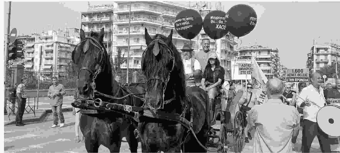
Το κάρο που προπορευόταν της πορείας.

τις φωτογραφίες του πρωθυπουργού Αλέξη Τσίπρα, του υπουργού Υγείας Ανδρέα Ξανθού και του αναπληρωτή Παύλου Πολάκη. "Τους αφήνουμε στον αέρα, όπως τα λόγια τους, που είναι λόγια του αέρα", έλεγαν.