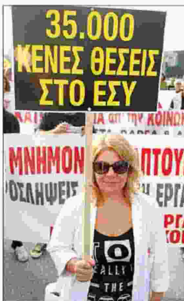
Η πορεία των εργαζομένων στα δημόσια νοσοκομεία (ΠΟΕΔΗΝ)

Τα... όργανα ωστόσο άρχισαν από χθες, με την πορεία της ΠΟΕΔΗΝ. Με... μαύρα άλογα και μπαλόνια που «σίκωσαν» στον ουρανό φωτογραφίες του Αλέξη Τσίπρα, του Παύλου Πολάκη και του Ανδρέα Ξανθού, οι εργαζόμενοι των νοσοκομείων της Θεσσαλονίκης πραγματοποίησαν μεγάλη πορεία διαμαρτυρίας. Η πορεία ξεκίνησε λίγο μετά τις 8 από το Ιπποκράτειο, έχοντας στην κεφαλή της μια άμαξα με δύο μαύρα άλογα, η οποία μετέφερε έναν ασθενή-κούκλα. Την πορεία ακολουθούσαν εργαζόμενοι