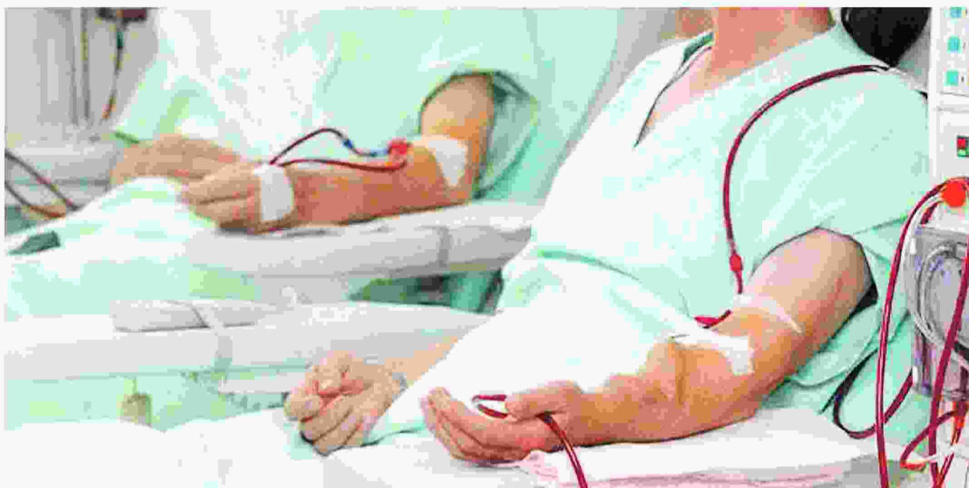
Στο «ΑΧΕΠΑ» από τα 22 μηχανήματα αιμοκάθαρσης τα έντεκα είναι εκτός λειτουργίας εδώ και μήνες εξαιτίας της έλλειψης τεχνικής υποστήριξης από την εταιρεία.

Της Νικολέττας Μπούκα nikolettabouka@yahoo.gr