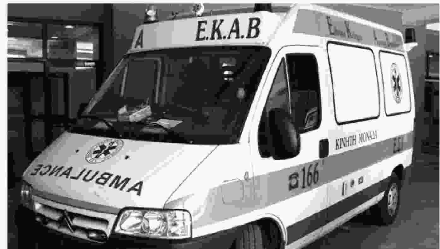
Η Ομοσπονδία εργαζομένων στο ΕΚΑΒ τάσσεται υπέρ της παραμονής του τηλεφωνικού κέντρου του ΕΚΑΒ στο Βόλο

ασθενοφόρα οχήματα είναι ακινητοποιημένα, τα 6 από αυτά είναι για απόσυρση. Σε επιχειρησιακή ετοιμότητα βρίσκονται καθημερινά σε όλη τη Θεσσαλία 21-22 ασθενοφόρα, θα έπρεπε με βάση τον πληθυσμό και την έκταση να είναι τα τριπλάσια».