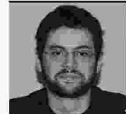
Επιμέλεια ΓΙΩΡΓΟΣ ΚΑΛΑΙΝΗΣ

Σ τοιχεία για την «ελλιπή επιχειρησιακή ικανότητα του ΕΚΑΒ» παραθέτει η Πανελλήνια Ομοσπονδία Εργαζομένων στα Δημόσια Νοσοκομεία (ΠΟΕΔΗΝ), επιστημαίνοντας ότι «ο στόλος του ΕΚΑΒ είναι σε φθίνουσα αριθμητική πορεία, εξαιτίας συνεχών βλαβών -υψηλός μέσος όρος ηλικίας των οχημάτων και διανυθέντων χιλιομέτρων.