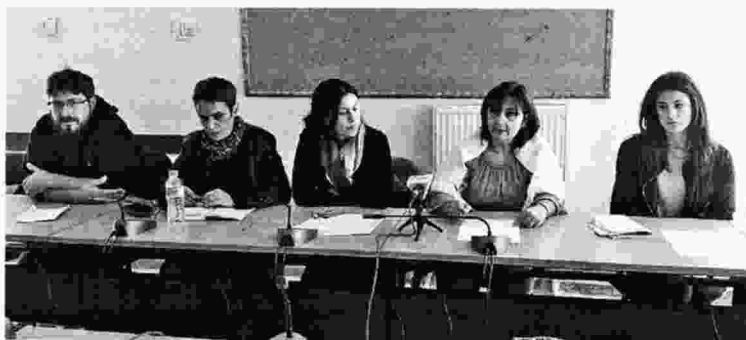
Από τη χτεσινή συνέντευξη Τύπου των σωματείων που διοργανώνουν την κινητοποίηση

Καταγγέλλθηκε ότι η κυβέρνηση υλοποιεί κατά γράμμα τις πολιτικές των προκατόχων της, ενώ με τα νέα μέτρα που αποφασίζει, όπως η μείωση της