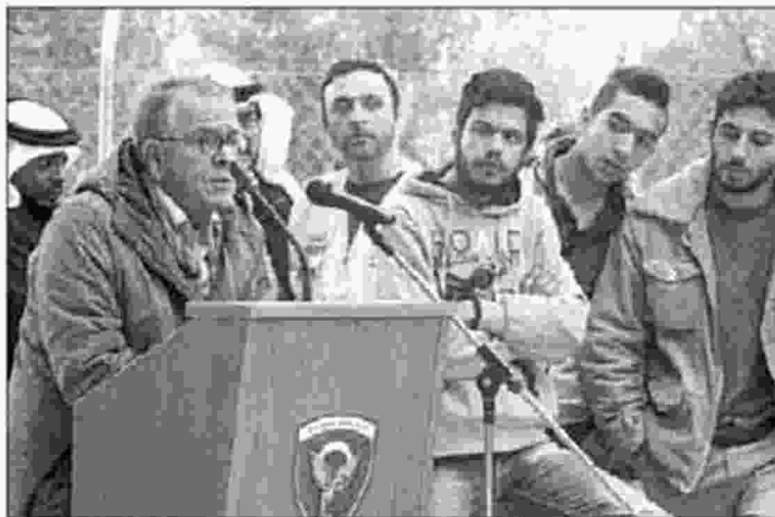
Ο υπουργός Μεταναστευτικής Πολιτικής, Γιάννης Μουζάλας, κατά τα εγκαίνια της ανακατασκευασμένης δομής προσφύγων στην Ριτσώνα

Ο υπουργός κατηγορήσε τον Δήμο Χίου ότι υπαναχώρησε έναντι των δεσμεύσεων για κατασκευή νέου καταλυ-