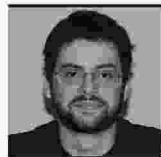
Επιμέλεια ΓΙΩΡΓΟΣ ΚΑΛΛΙΝΗΣ

Ειδικότερα, αν και η ποιότητα του ατμοσφαιρικού αέρα φαίνεται να βελτιώνεται σταδιακά, η ατμοσφαιρική ρύπανση, ιδιαίτερα στα αστικά κέντρα, εξακολουθεί να παραμένει ο μεγαλύτερος περιβαλλοντικός κίνδυνος στην Ευρώπη και ένας σοβαρός κίνδυνος για τη δημόσια υγεία. Αυτό έχει ως αποτέλε-