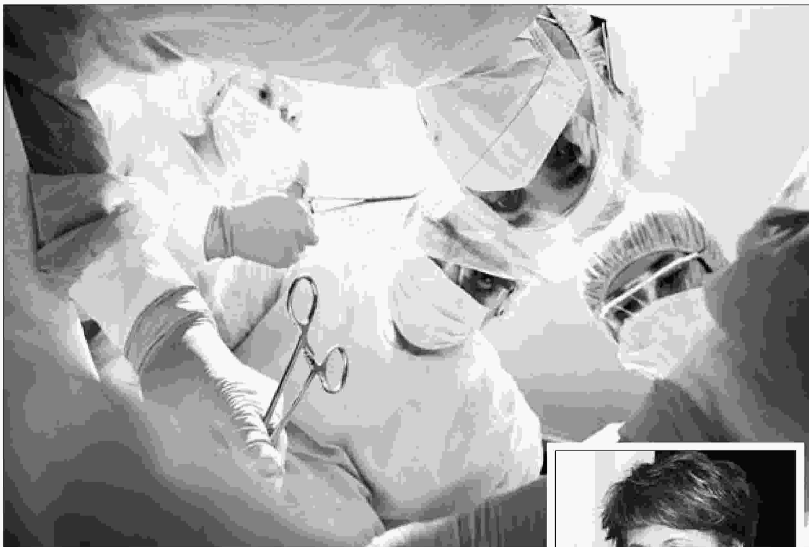
Η ΕΔΕ δεν κατέληξε σε συγκεκριμένο συμπέρασμα για τους υπεύθυνους του θανάτου της 4χρονης