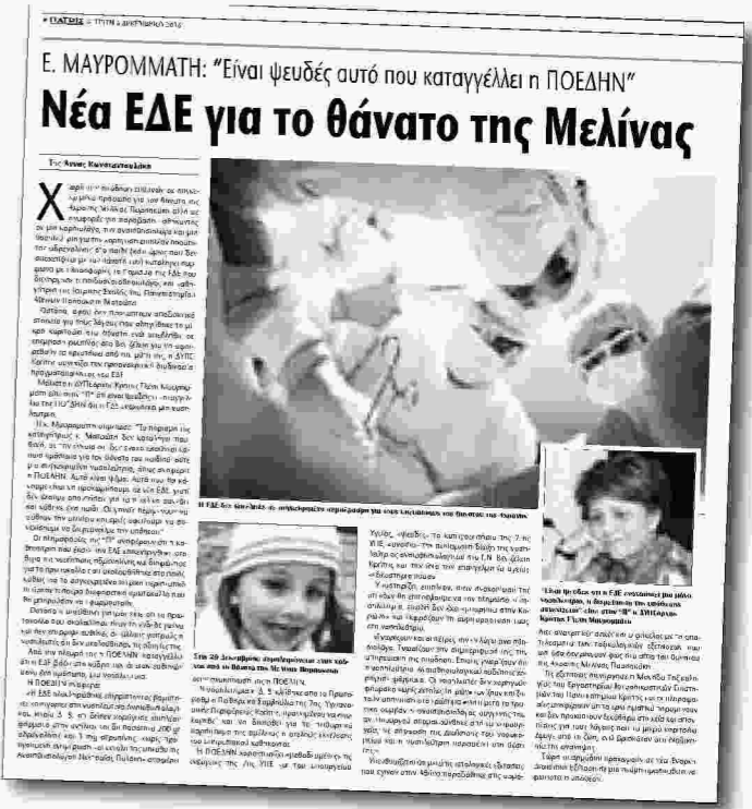
Το προχθεσινό αποκλυπτικό ρεπορτάζ της "Π" που έφερε στο φως της δημοσιότητας τη νέα εξέλιξη για την υπόθεση

Τι απαντά η ΔΥΠΕάρχης “Δεν θέλω να ακολουθήσω τον κατήφορο της ΠΟΕΔΗΝ,